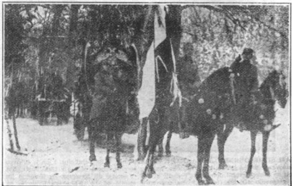
Sprevod vojakov kraljeve garde z badnjakom.

Ob zaključku pravoslavnih božičnih praznikov je praznovala svoj rojstni dan Nj. Vel. kraljica-mati Marija. Njen rojstni dan ni bil dan veselja, marveč dan globoke tuge, ker ji je istega dne pred tremi meseci kruta usoda ugrabila dragega življenjskega tovariša Nj. Vel. kralja Aleksandra. Lani ob tem času je bila z njim deležna v Zagrebu najlepših dokazov velike vdanosti in spoštovanja državljanov. Letos jo je božič — praznik miru, našel kot vdovo v kraljevskem dvoru, kjer je preživela toliko srečnih dni. Kakor je ta njena sreča blagodejno obsevala vso Jugoslavijo, ko je bila kraljica Marija vsem jugoslovenskim ženam in materam najlepši vzor, tako so tudi sedaj v dobi globoke žalosti vse oči uprte v njo — v najsvetejši vzor duševne veličine pri izpolnjevanju najvišjih dolžnosti. Neomajna je ostala tudi po najokrutnejšem udarcu usode, ki jo je zadela pred tremi meseci. Po njem je postala zgledna junakinja najhujših bojev, ki jih mora voditi jugoslovenski rod za svojo srečnejšo bodočnost.