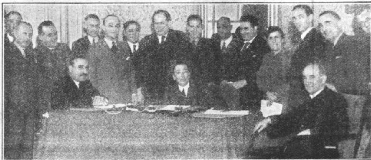
Na levi srednji sliki vidimo kako pozdravljajo novinarji g. Jevtića ob njegovem prihodu v Ljubljano, desna srednja slika nam pa kaže g. Titulesca v razgovoru z novinarji. — Spodnja slika: Državniki male antante med novinarji v banski palači.