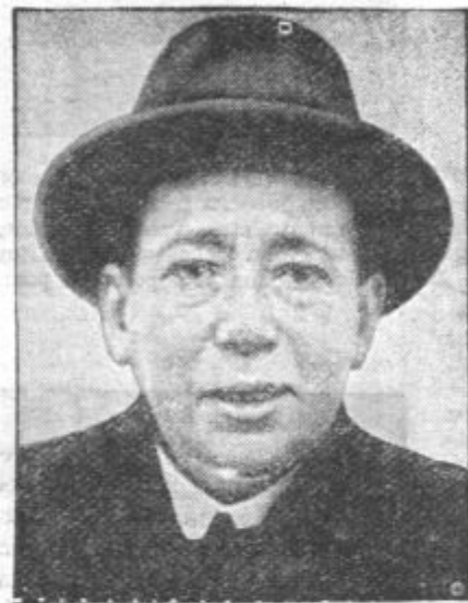
Naše slike nam kažejo po vrsti od leve na desno: Našega zunanjega ministra dr. Jevtića, češkoslovaškega zunanjega ministra dr. Beneša in rumunskega zunanjega ministra dr. Titulesca.