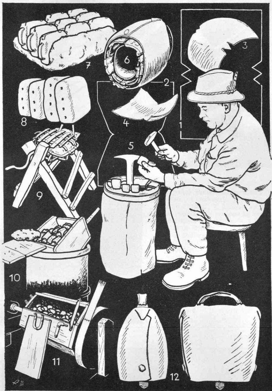
Sl. 1. Iz zvončarstva na Višelnici pri Gorjah: 1.—2. pločevinasti ploščici z zobom in brez njega, 3.—4. z bokanjem spremenjena oblika teh ploščic, 5. po bokanju zaviljuje zvončar na »šperaki« oba dela ploščice v obliko zvonca, 6. za lotanje vložijo več zvoncev razne velikosti drugega v drugega, 7. iz tako zloženih zvoncev napravijo tri vrste na ilovnati plasti, 8. vrste zvoncev zaviljuje v ilovnat »pušl«, 9. »valavka« ali »valavčca«, kjer vrte pušel po lotanju, 10. odprta »mišanca« z zlatanimi zvonci na čeburu vode, 11. »drumla« za čiščenje zvoncev, 12. gorjanski zvonec z dveh strani (risal I. Romih)