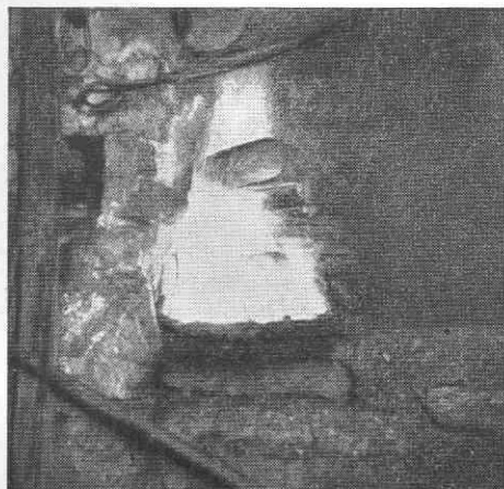
Sl. 3. Na ješi se na ognju pečejo pušlji (dva zakriva ogenj, tretji — na mačku — je dobro viden)