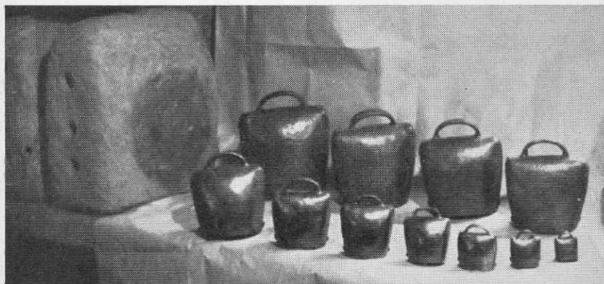
Sl. 4. Pušlja in gorjanski zvonci različne velikosti (foto B. Orel, 1950)