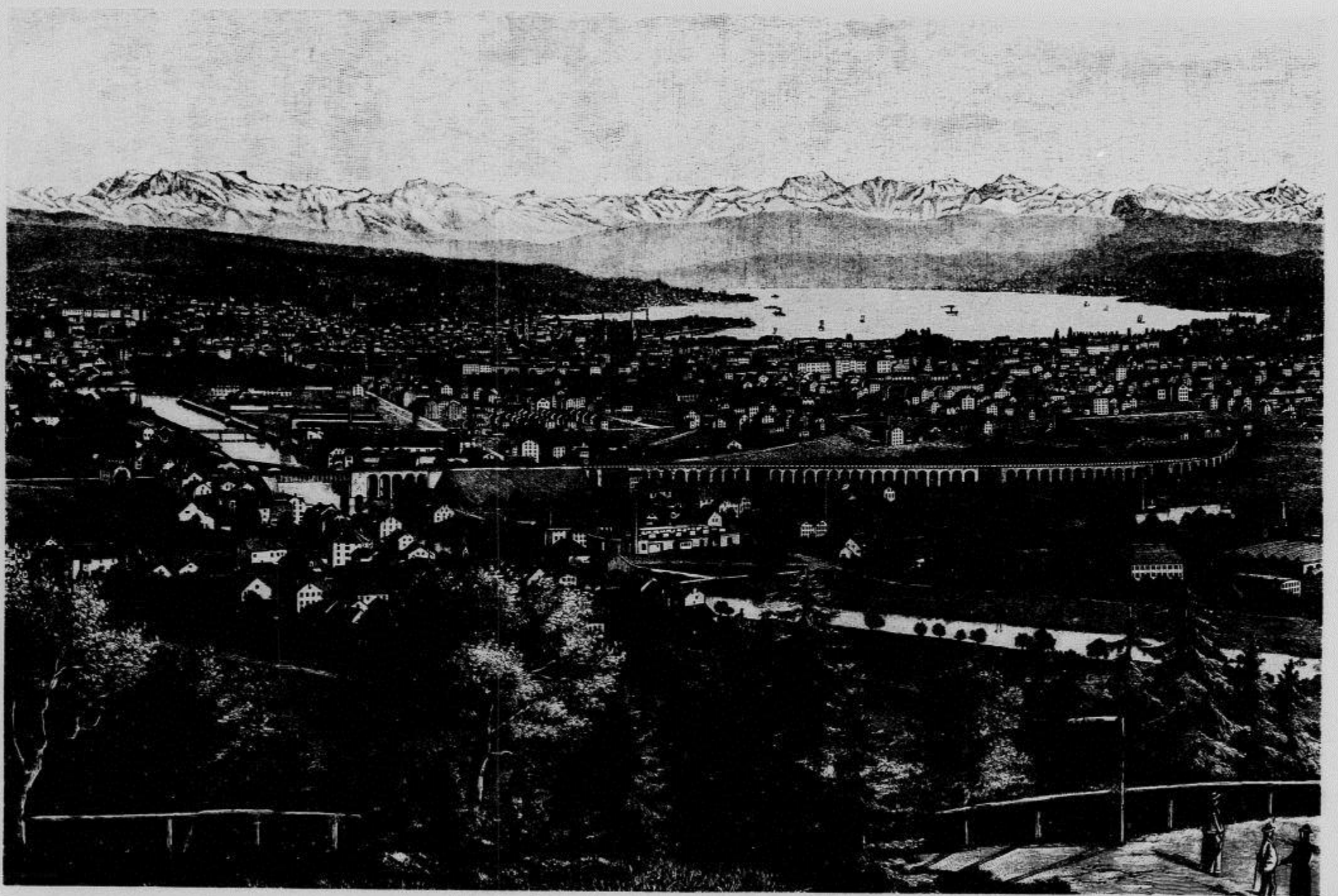
Ansicht von Zürich. Nach einer photographischen Aufnahme von Guler daselbst. (Mit Text.)