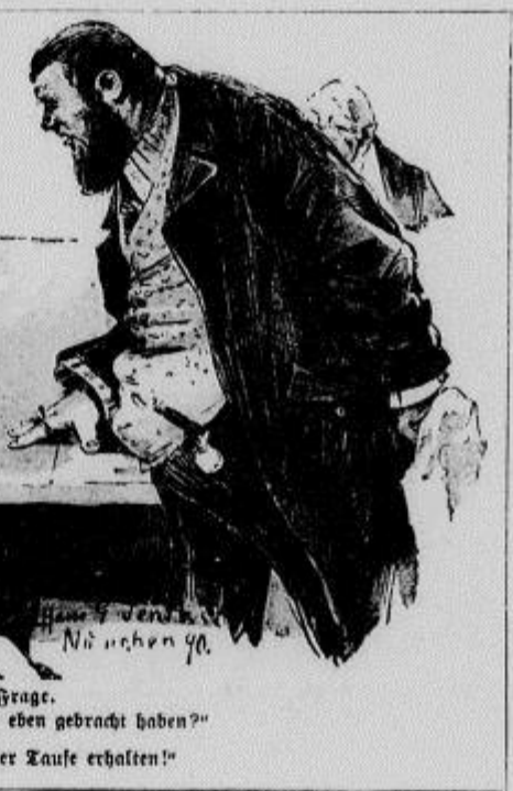
Boohajste Frage. Gast: „Was ist das für ein Wein, den Sie eben gebracht haben?“ Wirt: „Das ist Chateau Margaux.“ Gast: „Den Namen hat er wohl erst bei der Taufe erhalten!“

Wurzelballen, daß man sich in demselben frei bewegen kann. Dann bedeckt man mit einem stumpfspitigen Stöcke die Erde zwischen den Wurzeln heraus, hebt mittelst zweier links und rechts an den Stamm festgebundener Pfähle den Baum hoch und entfernt den Rest Erde; alle abgehauenen Wurzeln werden mit der Schere glatt geschnitten, die Schnittfläche nach unten gerichtet. Im neuen Pflanzloch, welches vorher aufgeworfen wurde, befestigt man den Stamm mittelst der an ihren Enden auf Böcke gelegten Pfähle hängend in richtiger Höhe (keinen Baum zu tief) und fällt nun langsam die mit besserer Erde gemischte Loch-Erde zwischen die Wurzeln hinein, indem man zuweilen mit den Stöcken nachschlägt und mit Wasser nachschlemmt.