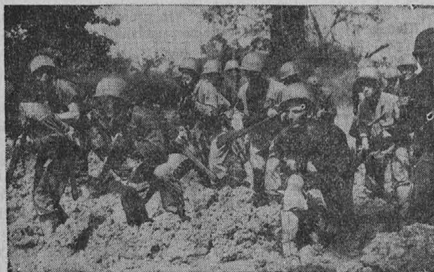
Na sliki vidimo ameriško vojaštvo globoko v džungli v karibski pokrajini.

tov Juža prešel. Bilo jih je devetnajst. Vsi so tiščali v roki ročico, branovlek, ali pa krepko planko.