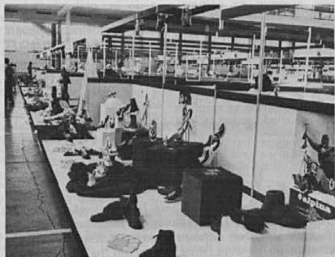
Z beograjskega velesejma, kjer je rastavljala tudi Alpina