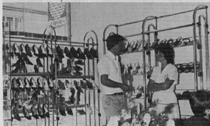
Razstavljeno blago omogoča dostop kupcem