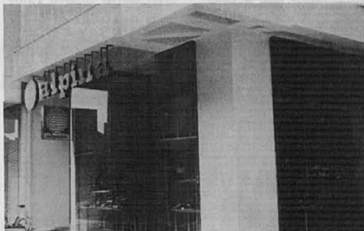
Takole izgleda zupanjost prodajalne v Bjelovaru