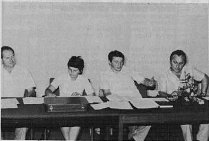
Vodstvo konference na Bledu

Tekst: Nejko Podobnik