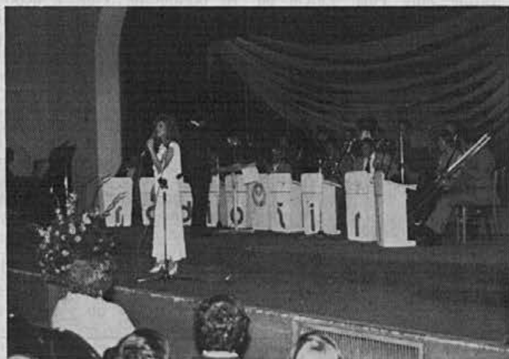
Najbolj je navdušil amaterski plesni orkester iz Celja

škoda, da ni bilo poslušalcev več. Očitno je, da ta vrsta v Žireh še ni prodrla, kar je pravzaprav razumljivo, saj dejavnost ni razvita, prav gotovo pa so se ob poslušanju skladb že dokaj uveljavljenih orkestrrov marsikomu porodile misli, da bi tudi v Žireh ustanovili podoben glasbeni ansambel.