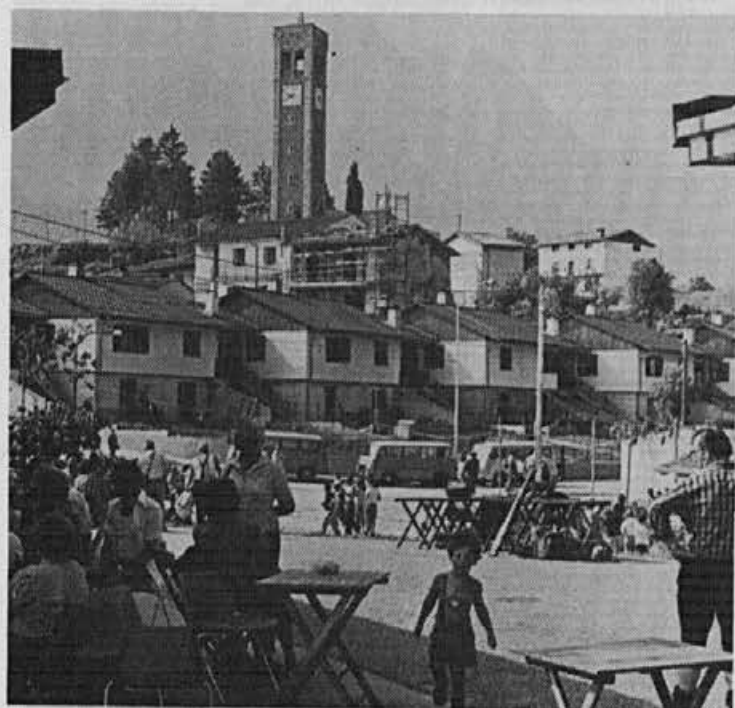
Obnovljena vas Brdo v Beneški Sloveniji

imenuje Beneška Slovenija. Po vojni med Beneško republiko in Avstrijo je bila Beneška Slovenija nekaj časa pod Avstrijo. Toda tudi novi gospodarji Avstrijci so jih pustili v nezavidljivem položaju ali jim omejevali še tiste narodnostne pravice in samostojnost, ki so jo dotlej imeli. Pred več kot stoletdesetimi leti so se s plebiscitom odločili za združeno Italijo, ki jim je ob svojem nacionalnem preporodu obljubljala mnogo pravic in boljši ekonomski položaj, slovenske šole, slovenske cerkvene besede. Toda z obljubami ni bilo skoraj nič. Italijani še do danes niso priznali niti Furlanom, niti Beneškim Slovincem svojih šol. Tržaški in goriški Slovenci so si po dolgotrajnem boju le izbojevali svoje šole in najnujnejše narodnostne manjšinske pravice, medtem ko Beneške Slovence, Režijane in Slovence v Kanalski dolini še čaka težak in neizprosni boj, brez (Nadaljevanje na 16. strani)