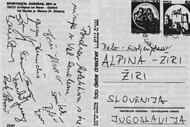
S treninga se oglašajo naši reprezentanti

SPORTHOTEL KURZHAUS, 2011 m 39020 Schkeibitz bei Meran - Südtirol Val Senales pr. Merano (Pr. Bolzano)