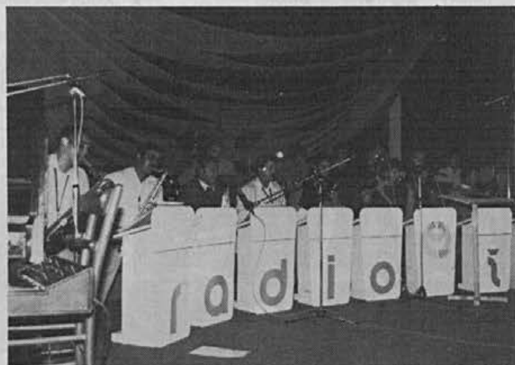
Z izborom skladb so posebno izstopali godbeniki iz Idrije.