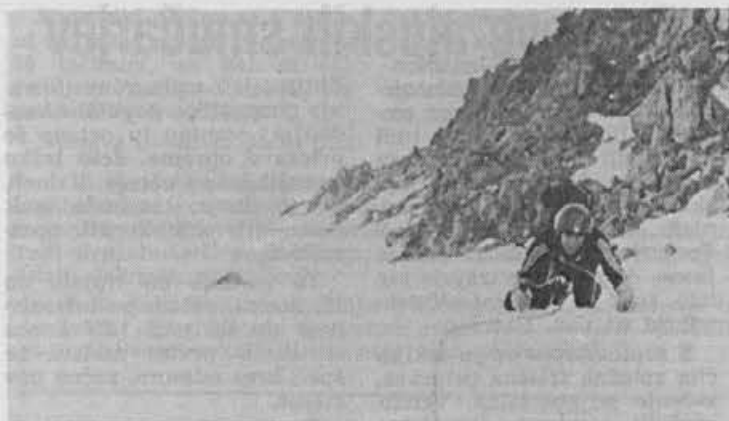
Tale ledenik je premagal naš sodelavec Stane Stanonik