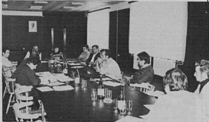
O nadaljnem delu sindikalne organizacije so razpravljali tudi predsedniki osnovnih organizacij zveze sindikatov

Da bi resolucijo lahko konkretizirali, so poleg sindikalnih delavcev zlasti odgovorne druge družbenopolitične organizacije in poslovodne strukture.