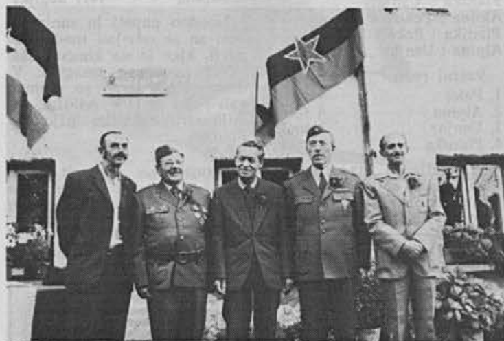
Na Javorču na Žirovskem vrhu je bilo odkritje spominske plošče kurirske postaje G9. Tole so nekdanji kurirji te postaje.

Približujemo se skalnati obali in belim stenam, ki imajo ime Zlate stene, katerih bele stene so se včasih ob rdečkasti zarji zahajajočega sonca svetile kot zlate. Danes so na njihovih skalnatih pobočjih zgrajeni