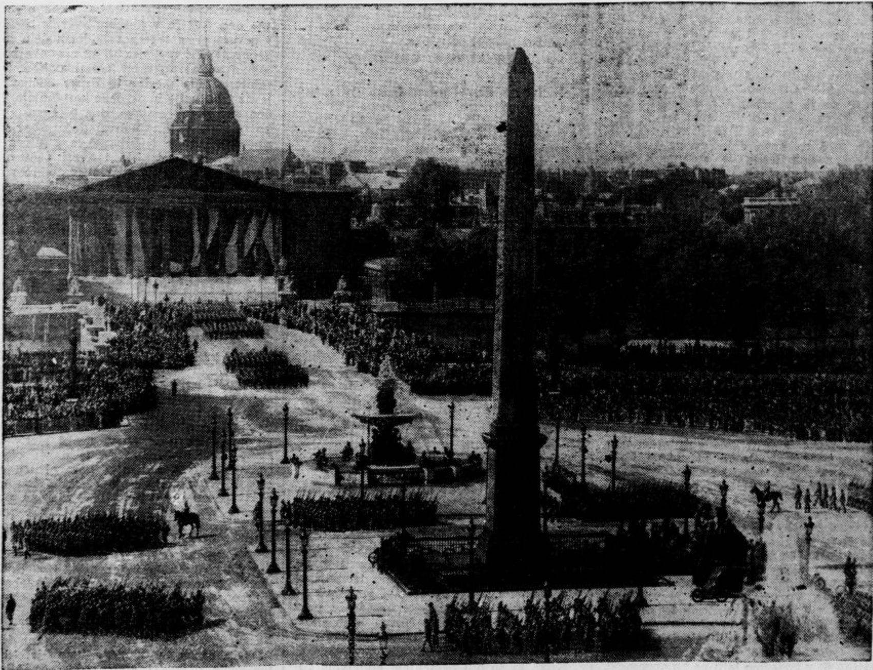
Proslava francoskega narodnega praznika na dan 14. julija je bila letos v Parizu posebno veličastna. Na zgornji sliki vidimo delno vojsko na Place de la Concorde.