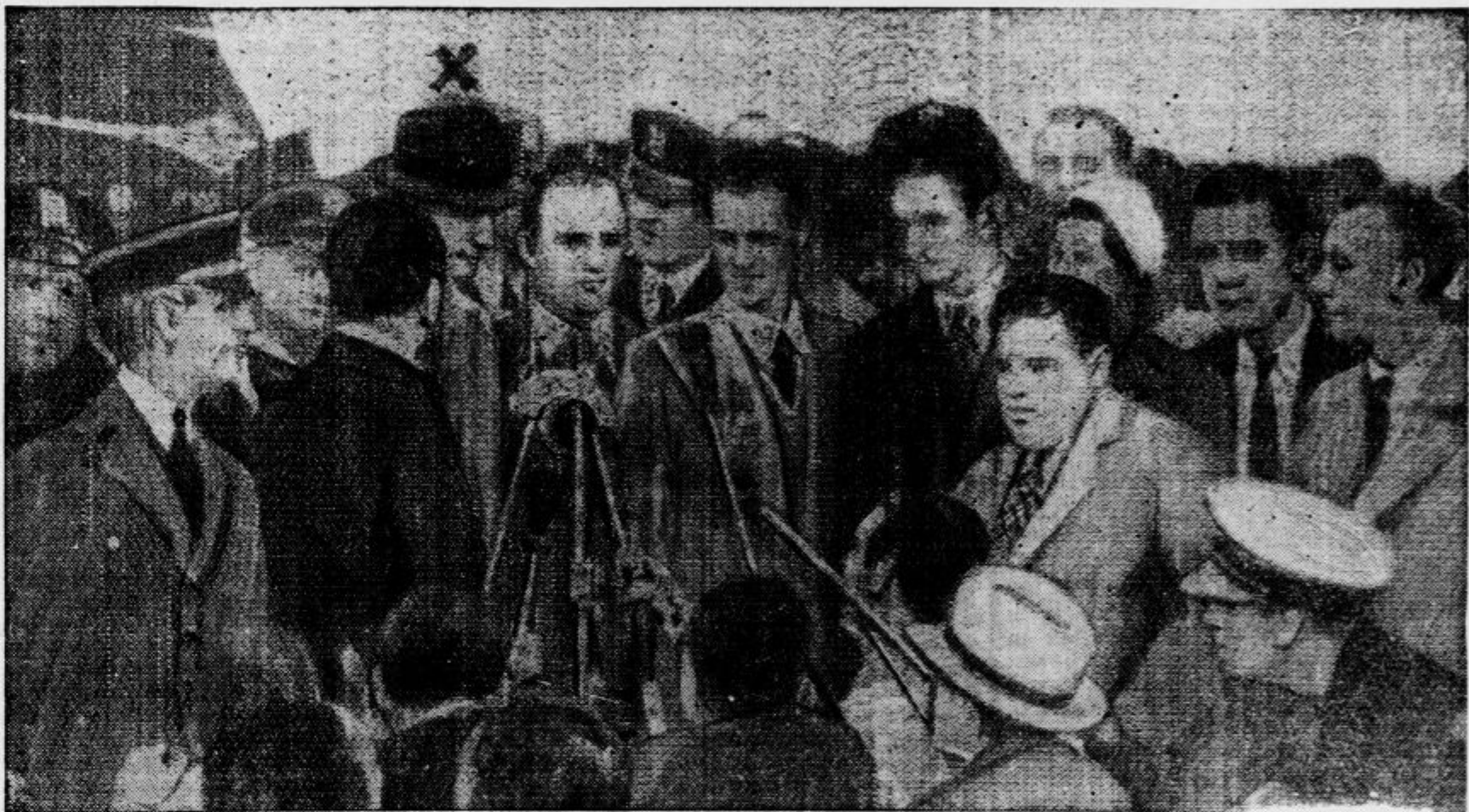
Na Floyd Bennetovem letališču v New Yorku so sprejele milijonarja Howarda Hughesa, ki je srečno dovršil polet okoli sveta s pomočjo štirih letalskih strokovnjakov, velike množice in predstavniki oblasti. — Na desni vidimo tudi njujorškega župana La Guardia