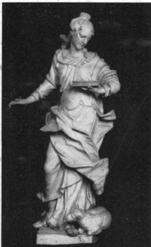
21. jan. Sv. Neža. (Kip Robbove delavnice iz srede 18. stol. Uršulinke, Ljubljana).

Največ zastopnikov vnanjih držav ima — Vatikan. Sveta stolica