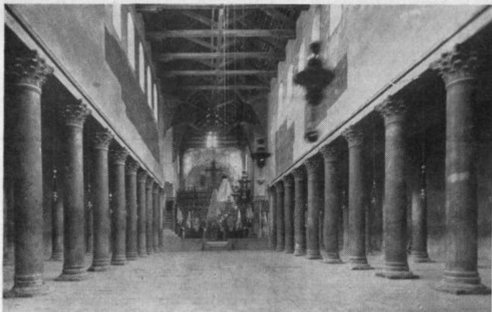
Bazilika Kristusovega rojstva.

Socialni pomen krščanstva. Rešitev socialnega vprašanja ni v krivi veri zločinskega komunizma, marveč v krščanstvu, ki združuje pravičnost z ljubeznijo, ki celi rano pri korenini. »Kristus ne pripada nobeni stranki, nobenemu družabnemu razredu, nobenemu programu, — Kristus pripada vsem in vsakemu; ne socializira tovarn, obratov, rudokopov, strojev — to bi bilo površno zdravljenje bolnika in bi pospešilo le smrt —; Kristus socializira, pobrati ljudi, poboljša