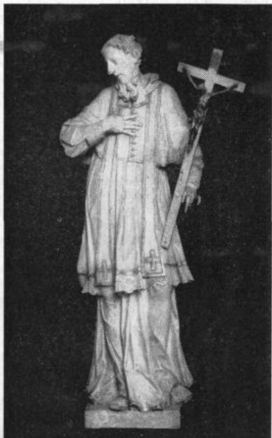
29. jan. Sv. Frančišek Sal. (Kip Robbove delavnice iz srede 18. stol. Uršulinke, Ljubljana).

poslušanje prijetna tudi ne; pogosto kar zoprna, skoraj nesлана.