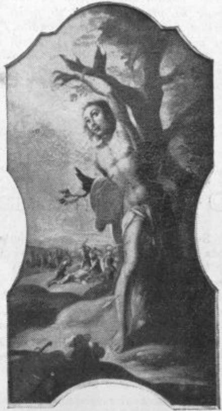
20. jan. Sv. Boštjan — (Fort. Bergant).

V Efezu si je Marija izdojevala svojo prvo svetovno zmago. Vse naše verske resnice so se izkristalizirale v verskih bojih in se lepo izoblikovale na nakovalu preganjanj. Skoraj vsak člen naše vere je oškropljen in posve-