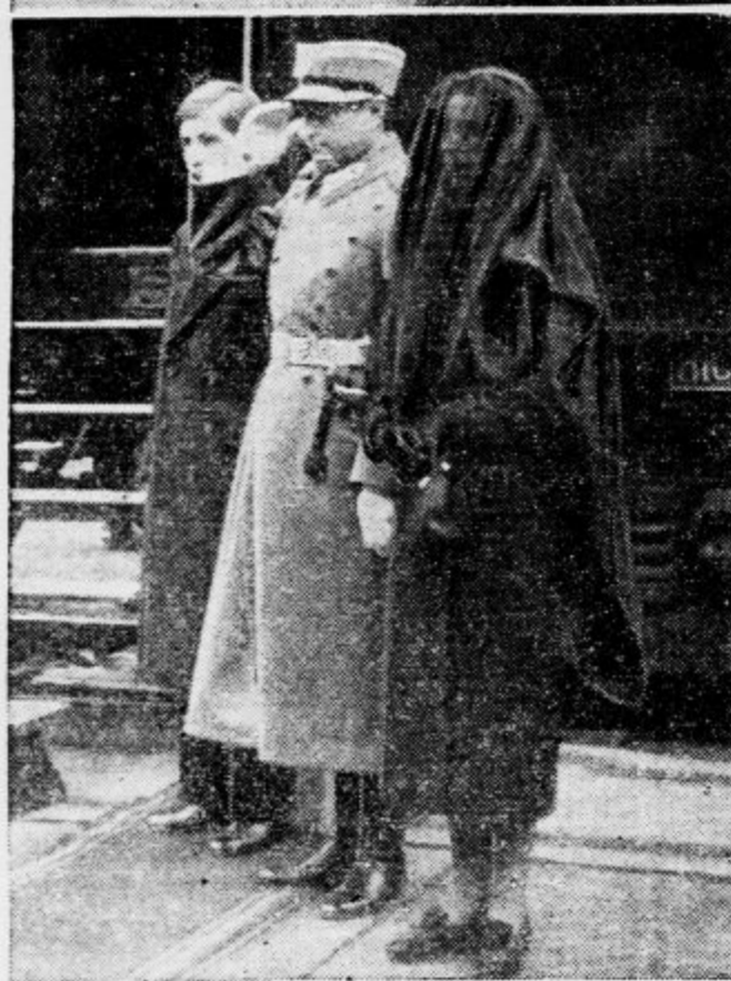
Desno spodaj: Nj. Vis. knez namestnik Pavle, Nj. V. kralj Peter II. in kneginja Olga zapuščajo cerkev na Oplencu po dovršenih pogrebnih svečanostih.