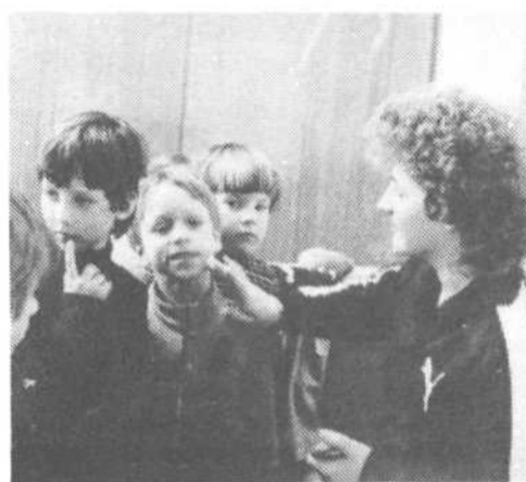
Brez zaščitne kreme ne mine tudi zimovanje. Na srečo je potrebno namazati le obraz, ki to pazljivo rad povrne z lepo zagorelostjo.