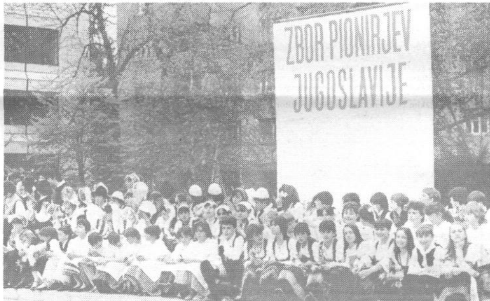
LJUBLJANA JE GOSTOLJUBNO ODPRLA VRATA - V slovenskem glavnem mestu so se zbrali pionirji in njihovi mentorji iz središč vseh republik in pokrajin.