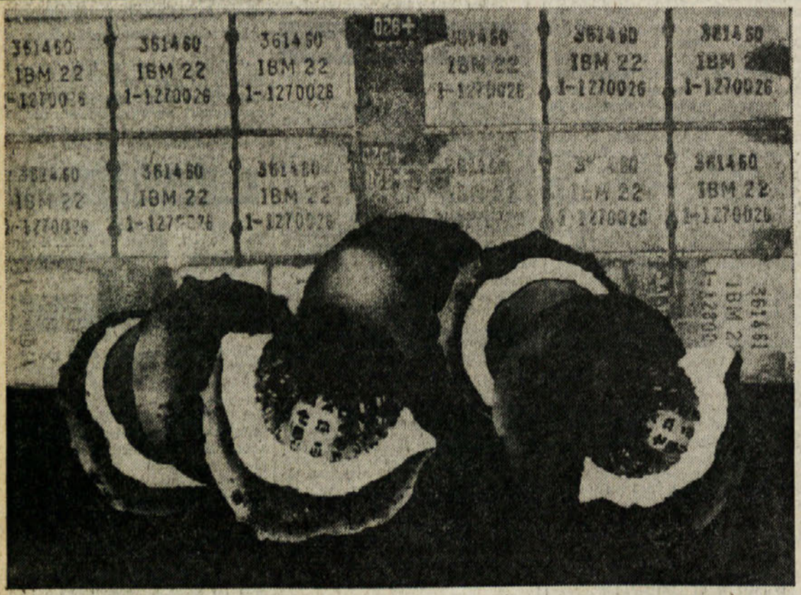
V nedeljo bodo v miljski občinski galeriji «La Squero» odprli razstavo del šestih slovenskih grafikov, med katerimi bodo tudi dela grafika Jožeta Spacala. Na sliki eno njegovih del: «Kostanj» (akvainta)