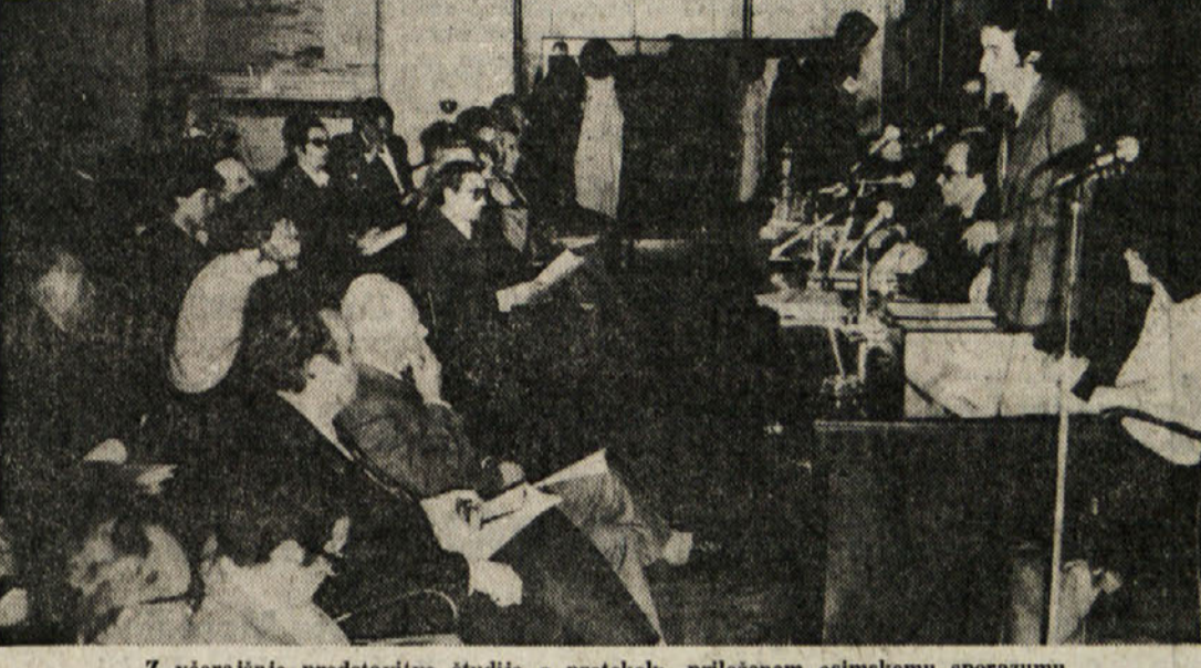
Z večeršnje predstavitve študije o protokolu, priloženem osimskemu sporazumu