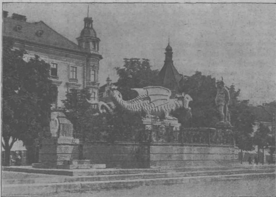
»Lintvern« na Novem trgu v Celovcu.