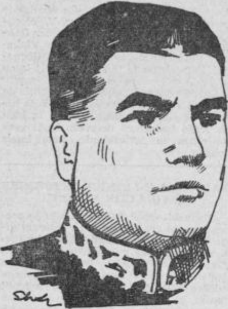
Novi obrambni minister Sovjetske zveze maršal Malinovski.

Začnimo s Francijo. Vladna kriza še vedno traja. Mollet ni sprejel ponudbe komunistov, s katerimi bi komudno vodil parlament, češ da bi to Francijo dovedlo madžarski oktober, z desnico pa se vsaj načelno ne razume, čeprav njegov program nič ne razodeva delav-