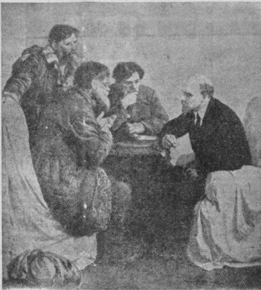
Poslušal jih je in jih bodril. Na sliki ga vidimo v pogovoru s kmeti... Lenin ni bil samo velik mislec in revolucionar. Bil je skromen in preprost v značaju. Dasiravno je v takratnih burnih dogodkih moral biti povsod na najbolj nevarnih in izpostavljenih mestih. Čeprav so se vse niti revolucije stekale v njegove roke, je Vladimir Iljič vedno našel čas za pogovor z navadnimi ljudmi.

Ta zavest bo ob prazniku 40-letnice Oktobrske revolucije vsem našim delovnim ljudem in med njimi najzaslužnejšemu nadaljevalcu zmagovite Lenineve misli, tovarišu Titu, močna spodbuda, da bomo v duhu Leninovih načel delo nadaljevali za blaginjo naših narodov in za sožitje v svetu.