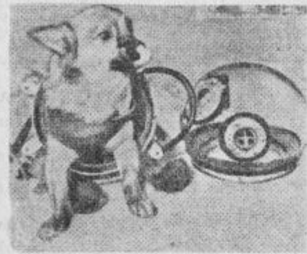
Eskimski pes Lajka — najbolj popularna »osebnost« te dni. Kako ne, saj je prvi vsemirski potnik. Srečno pot!

Drugi načrt je zanimiv in, vsaj zdi se tako, laže izvedljiv. Posebna raketa (še najbolj podobna večmotornemu orjaškemu reakcijskemu letalu) bi ponesla drugo manjšo raketo (pravzaprav celo družino raket, ki bi izstreljevale druga drugo). Zadnja, najmanjša, bi priletela na luno. (Glej slike in komentar pod njimi.)