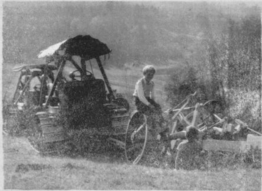
Okoli buldozerjev se nabira mladina. Tipajo ju, ogledujejo velikanski plug, skačejo po globoki brazdi, iz katere veje toplota zemlje. Kar pozabljajo, da je treba domov. Da, da. Nov čas oznanjajo te, tankom podobne pošasti . . .

Končno še vinogradi . . . V tem vinorodnem kraju so vinogradi verjetno najvažnejši. Zato bo vinogradništvo tudi v