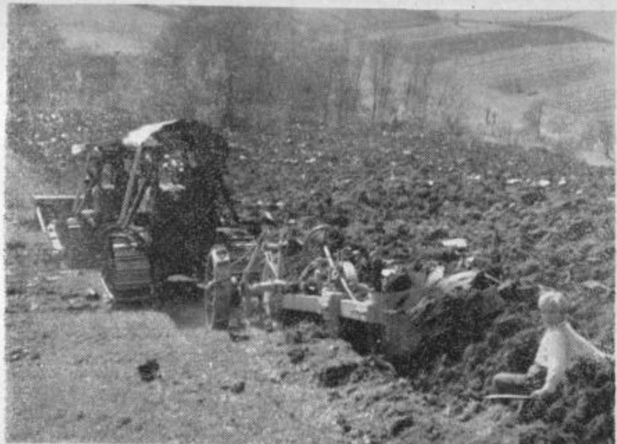
Dva močna buldozerja sta celo navzdol s težavo vlekla težak plug, ki je oral skoraj meter globoko »deviško« ledino. Koliko znoj in denarja je prihranila mehanizacija ljudem. Vsakih deset minut in še manj je nastala nekaj sto metrov dolga brazda, čeprav sta orala samo navzdol, navzgor pa rohnela po taki strmini kot streha . . .

Ponekod so sicer šli gledat, če bi se dalo kaj narediti, ko so se ravno bili tu. Toda premajhne so bile te površine. Ne bi se izplačalo . . . Interesanti, ki želijo tako hitro in temeljito obnovi, si lahko grede ogledat v Imenu njihovo naslednje delovišče. Tu so kmetje »stopili sku-