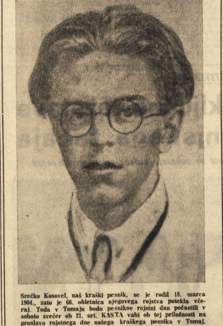
Srečko Kosovel, naš kraški pesnik, se je rodil 18. marca 1904, zato je 66. obletnica njegovega rojstva potekla včeraj. Toda v Tomaju bodo pesnikov rojstni dan počastili v soboto zvečer ob 21. uri. KASTA vabi ob tej priložnosti na proslavo rojstnega dne našega kraškega pesnika v Tomaju. Odhod ob 16. uri s Trga Oberdan.