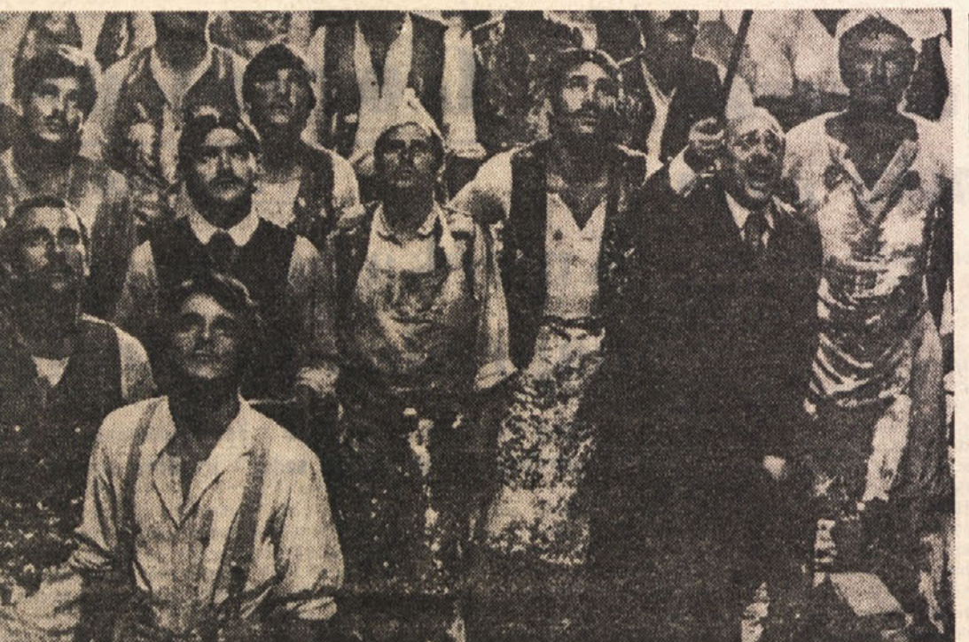
Mauro Bolognini, znani italijanski režiser, je posnel film «Metello» po istoimenskem romanu Vasca Pratolinija. Zelo resni recenzenti menijo, da gre verjetno za doslej njegov najboljši film.