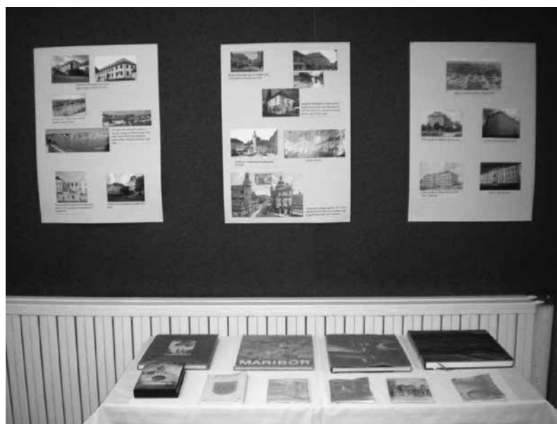
Slika 1: Razstava v knjižnici.

Ljudje smo vizualna bitja, zato medpredmetno načrtovanje pouka z ogledom tematske razstave v šolski knjižnici širi bralno pismenost na prijeten način, bistveno prispeva k razvoju učenčevega dejavnega odnosa do kulture in kulturne pismenosti, sooblikuje njegovo estetsko občutljivost, dviguje raven znanja, ki je zato trajnejše, poglobljeno in bolj celostno, spodbuja učenčevo domišljijo, ustvarjalnost, pomeni drugačen pristop k učenju, saj ob ogledu razstave učenec snov bolje razume, je v procesu učenja aktivno udeležen, sam odkriva medpredmetne povezave in ne nazadnje take razstave pripomorejo k boljšemu učnemu okolju.