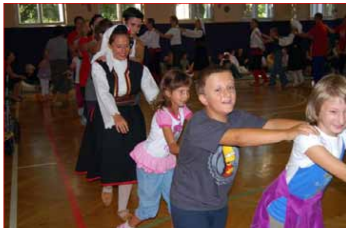
Folklorniki iz mesta Sombor, Srbija med obiskom OŠ dr. Ljudevita Pivka