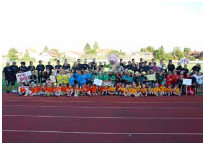
Skupinska slika udeležencev mini olimpijade.

V nedeljo smo nadaljevali z osrednjim dogodkom na Ptujskem jezeru, kjer so se lahko udeleženci preizkusili v nordijski hoji pod budnim očesom izkušene mentorja, ki je predstavil pravilen način tehnike hoje. Prav tako so udeleženci imeli možnost opraviti osnovni zdravstveni pregled (merjenje krvnega tlaka, pulz, merjenje maščob ...). Največje zanimanje je na račun lepega vremena požela vožnja z ladjico Čigra.