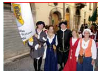
V začetku avgusta so predstavniki društva obiskali Sulmono.

Člani društva Cesarsko-kraljevi Ptuj so se v začetku julija že osmo leto zapored udeležili grajskih iger, imenovanih Burgfest, v pobratenem mestu Burghausen. Pridružili so se jim še tisti, ki so jih navdušile pretekle ptujске grajske igre in so želeli videti, od kod izhajajo. Med 5. in 7. avgustom so člani na povabilo vodje društva Borgo San Panfilo v Sulmoni prvič gostovali v tem italijanskem mestu na prireditvi Giostra Cavalleresca di Europa, na kateri konjeniki v polnem diru s sulicami poskušajo zadeči majhne obročke, ki visijo na posebnih stojalih. »Prireditve Giostra poteka v dveh delih, prvi konec tedna se pomerijo domače ekipe, naslednji pa v Sulmono povabijo goste iz različnih evropskih mest in jim z žrebom dodelijo konjenika, ki se bori za njihove barve. V začetku je bilo v načrtu, da sodelujemo kot del skupine iz Burghausna, vendar so nam organizatorji sporočili, da se odločili, da se pred-