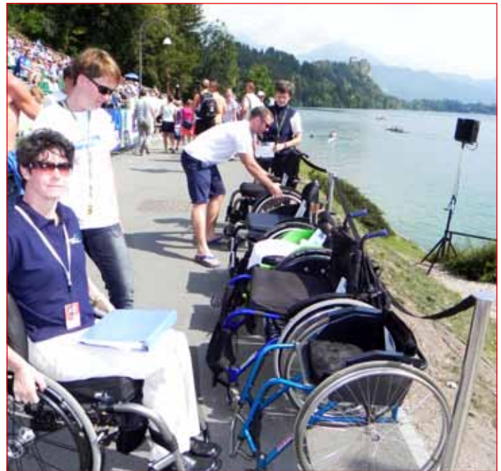
Vsi trije Ptujčani s predstavnico FISE (na invalidskem vozičku) v akciji ob pripravi potrebnih invalidskih pripomočkov za dobitnike medalj

Ta veslaški dogodek se je vpi-sal v zgodovino slovenskega športa, posebej še športa invalidov, saj je Slovenija prvič nastopila tudi z eno posadko invalidov v mešanem dvojnem dvojcu. Veslanje je namreč ena od redkih, če ne edina športna panoga, ki v okviru Mednarodne veslaške federacije FISE organizacijo svetovnih prvenstev pogojuje z izvedbo le-tega skupaj istočasno na istem mestu tako za neinvalidde kot invalide.