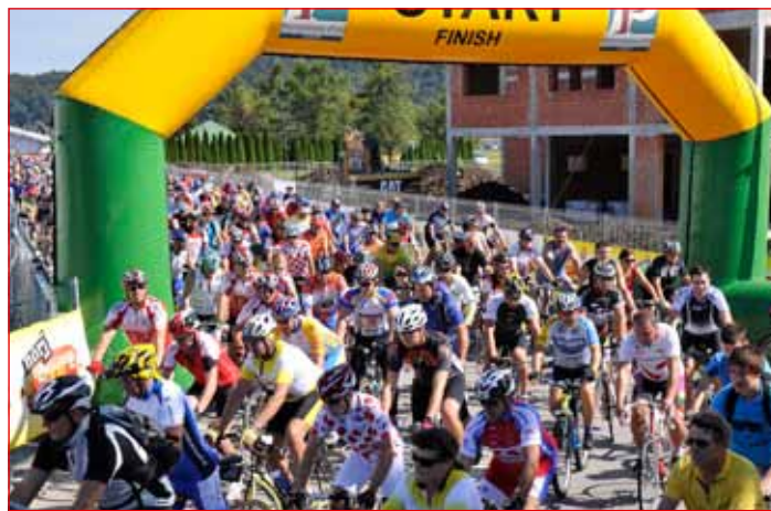
Na 9. Poli maratonu se je zbralo 5200 kolesarjev, ki so ustvarili pravi kolesarski praznik.

učil policist. Prihodnje leto bo Poli maraton praznoval jubilejno, 10. obletnico.