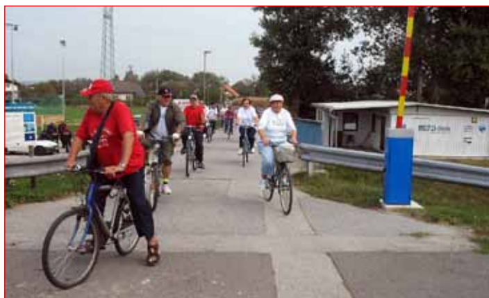
Prihod na Ranco ob Ptujskem jezeru

Organizatorje nas veseli, da se vsako leto pridružijo novi udeleženci skupinskega kolesarjenja in nas je vedno več. Vsem želim varno in zadovoljno vožnjo s kolesom skozi vse leto.