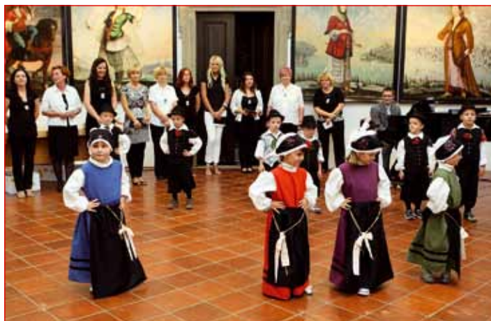
Otroci so zaplesali venček slovenskih otroških ljudskih plesov