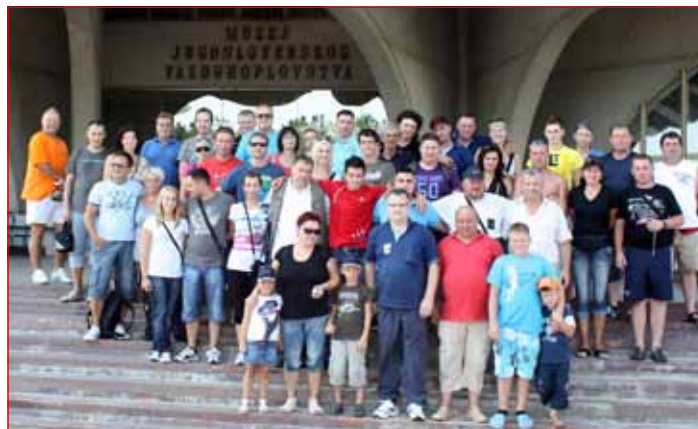
Izletniki pred muzejem vojnega letalstva v Beogradu