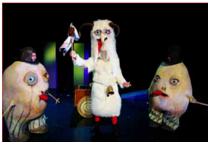
S predstave Kurent, prve letošnje premiere ptujskega gledališča

Samo dva dni po ptujski premieri Kurenta je bila 17. septembra v Prešernovem gledališču v Kranju premiera predstave Proti severnemu vetru , ki je nastala v partnerskem sodelovanju ptujskega in kranjskega gledališča ter je narejena po literarni predlogi, ki je ena največjih knjižnih uspešnic zadnjih let. Roman Proti severnemu vetru , v katerem si preko elektronske pošte moški in ženska spletata intrigantski romantičen odnos, je avtorju Danielu Glattauerju prinesel svetovno slavo in je tudi najbolj prodajana knjiga zadnjih let v nemško govorečih državah, prav tako pa je velik uspeh dosegla tudi pri