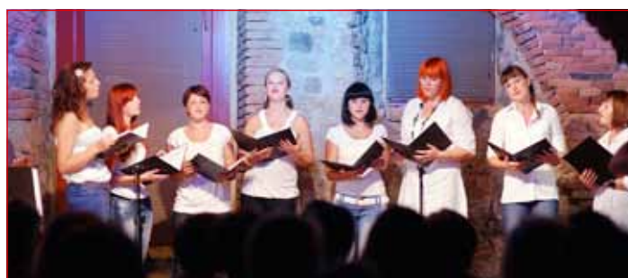
Mlade ljudske pevke iz Cirkulan med prepevanjem ljudskih pesmi v Muzikafeju