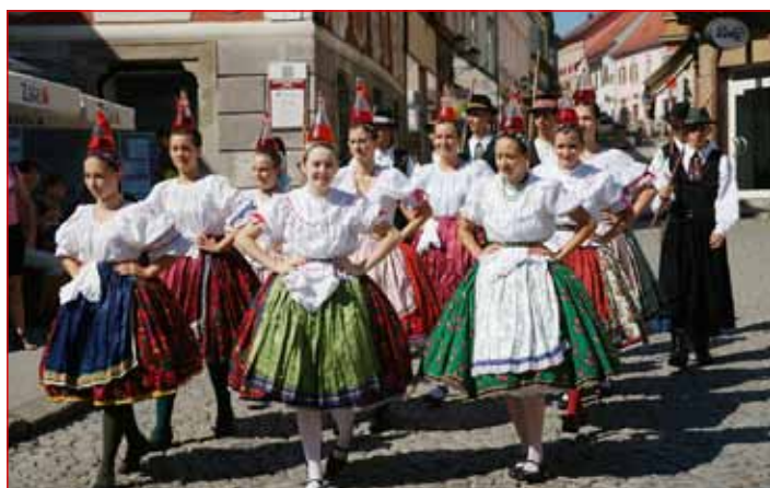
Madžarski folklorniki v sobotni povorki po starem mestnem jedru

Zanimiva in poučna je bila razstava rekonstruiranih ljudskih