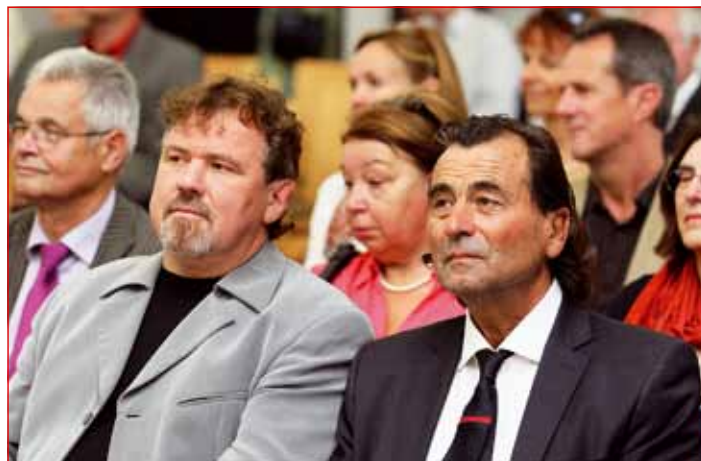
Župana sta v svojih nagovorih poudarila, da so najpomembnejše prijateljske vezi, ki so nastale v teh desetih letih.