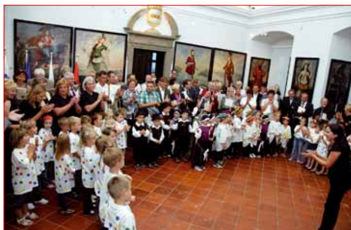
Svetniki obeh mest so ob zaključku skupaj z otroci vsak v svojem jeziku zapeli pesem Mi se imamo radi .