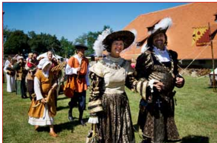
Vojvodski par iz pobratenega društva Herzogstadt Burghausen

Članom društva Cesarsko-kraljevi Ptuj je letos ponovno uspelo na grajske igre pritegniti atraktivne skupine iz Slovenije in tujine (Slovaške, Avstrije in nemškega Burghausna). Iz domačega društva so se na turnirskem prostoru predstavile bobnarska skupina Tympanum (edina srednjeveška bobnarska skupina v Sloveniji), plesna skupina Pellegrina, umetniška sekcija Graziosa z recitalom ter zeliščarice. Predstavili so se tudi srednjeveški popotniki iz Kočevja, Seinsensensis tumultus, viteški red Jurija in Volka Engelberta Turjaškega iz Žužemberka in plesna skupina Lonca iz Škofje Loke. Srednjeveško glasbo je predstavila glasbena skupina iz Burghausna Laudate Dominum, člani skupine Blout zi Bluoda iz Avstrije so prikazali stare tehnike mečevanja, Žoldnieri iz Slovaške pa so se borili z različnimi orožji (tudi s kosami). S palicami so se spopadla tudi njihova de-