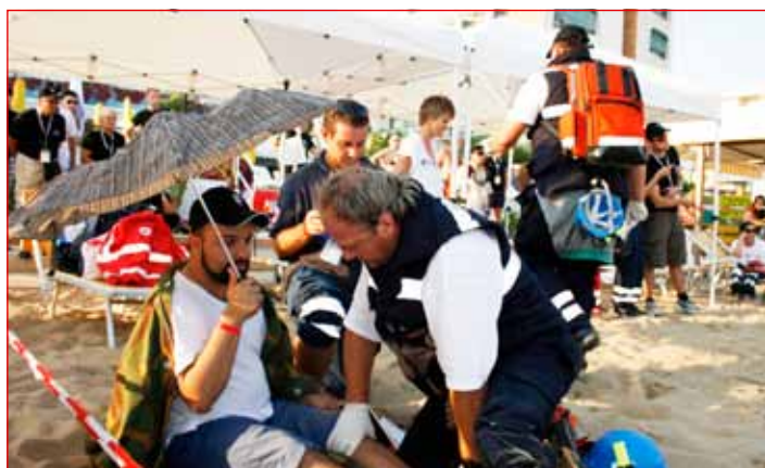
Ptujčani med tekmovanjem

S tem je tudi opravljena uspešna promocija prve pomoči Republike Slovenije in Mestne občine Ptuj. S prvo pomočjo pa je tako, da nanjo mnogi pomislijo šele takrat, ko jo potrebujejo. V MO Ptuj se zavedamo, da je to prepozno, zato se trudimo, da prostovoljno delo doseže najvišje profesionalne dosežke. Čestitke ekipi in vsem, ki so prispevali svoj delež v ta uspeh.