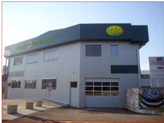
Nov Medpodjetniški izobraževalni center ob Volkmerjevi cesti

Šolski center Ptuj je tesno vpet v sodelovanje z gospodarstvom na področjih tehnike (strojništva, metalurgije, elektrotehnike, informatike, mehatronike in okoljevarstva) ter na področjih