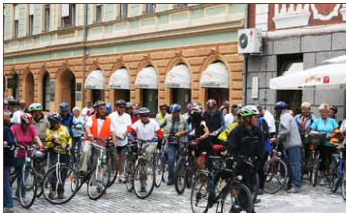
Kolesarji pred Mestno hišo na Mestnem trgu, kjer je bilo zbirno mesto pred pričetkom, in tudi zaključek kolesarjenja.

Tukaj smo si privoščili enourni postanek, in se okrepčali ter ob sončnem vremenu poklepetali o kolesarjenju v preteklih letih. Kolesarjenja so se udeležile vse starostne skupine, največ upokojencev, ki tudi skozi vse leto pridno kolesarijo. Zadovoljni smo se vračali po poti pod Puhovim