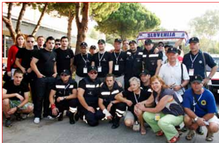
Ptujška ekipa bolničarjev z vsemi spremljevalci in odličnimi navijači, ki so ves čas tekmovanja skrbeli za dobro vzdušje.

V Sloveniji v primeru večje naravne ali druge nesreče prvo medicinsko pomoč nudi služba nujne medicinske pomoči. Ekipe prve pomoči CZ in RK ji služijo kot dodatna pomoč. V številnih državah pa ekipe prve pomoči