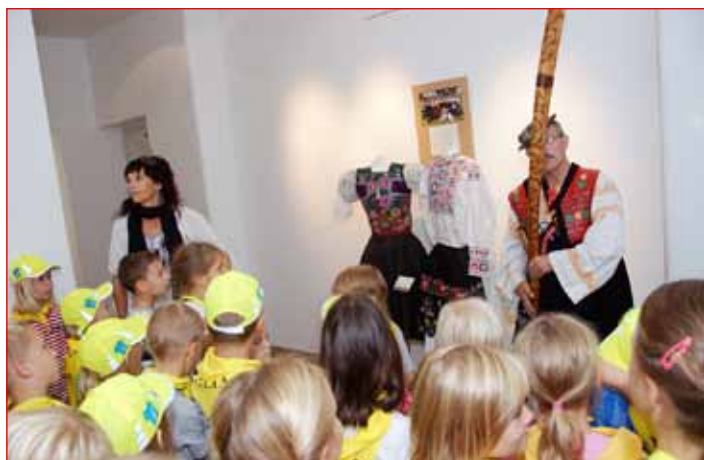
Predstavitve tradicionalnega instrumenta »Fujara« iz Slovaške med obiskom osnovnošolcev na razstavi rekonstruiranih ljudskih kostumov.

Z mnogo dobre volje, prostovoljnega dela in uvodnega entuziazma so organizatorji OI Javnega sklada za kulturne dejavnosti s partnerstvom Mestne občine Ptuj ter vseh, ki so sodelovali in mednarodno folklorno srečanje podprli, kimavčeve dneve in večere popestrili z vrhunskimi folklornimi programi raznolike in bogate ljudske dediščine med-