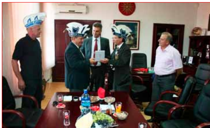
Predaja plakete MO Ptuj predsedniku FECC Makedonija ob 20. obletnici članstva Ptuja in Slovenije v FECC.

se je razprostiral rimski tabor, so si obiskovalci v štiridnevem rimskem dogajanju lahko ogledali raznolike prikaze rimskega vsakdana. Odvijali so se otroški rimski tabori, rimski spektakel, gladiatorske igre, prikazi borilnih veščin rimske vojske, ples vestalk in duhovnic, gladiatorske šole, zasedanja senata v rimskem amfiteatru in zaključek rimskih iger z rimskim pogrebom in slavnostno postavitvijo spominskega stebra. Na rimski tržnici so ponujali dobrote starih Rimljanov. V sklopu programa se je zgodila tudi Rimski komedija ptujskega gledališča in orientalski plesi. Naslednje leto, ko bo Ptuj kot partnersko mesto sodeloval v projektu EPK Maribor 2012, bodo prav rimske igre osrednja poletna prireditev.