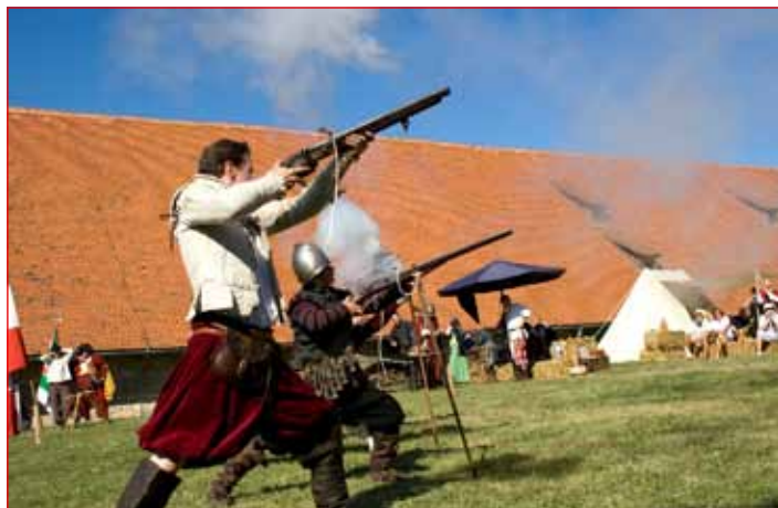
Izredno atraktivna skupina Žoldnieri iz Slovaške nastopa s prikazom borb z raznovrstnimi orožji.