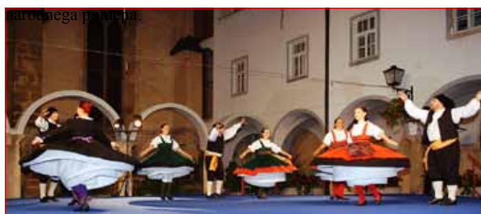
Plesalci Varteksa Varaždin med predstavitvijo plesov iz Otoka Krka v objemu minoritskega samostana