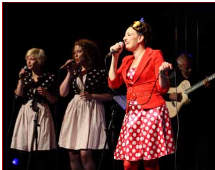
Koncert Bilbi na minoritskem dvorišču je privabil veliko število poslušalcev

Nastopilo je več kot 400 umetnikov, ki so na Ptuj privabili čez 10.000 obiskovalcev. Kljub slabemu vremenu v prvem tednu festivalskega dogajanja to ni zmotilo organizatorjev. Vse prireditve in koncerti so bili nemoteno izpeljani. Zahvala gre organizatorjem Arsane in postavitvi montažne strehe za obisko-