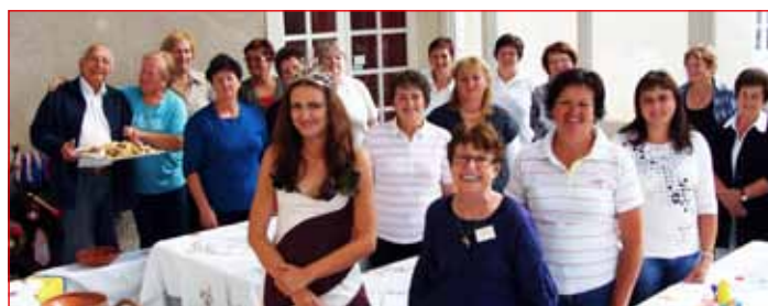
Ptujške predstavnice na razstavi

se tam predstavile številne organizacije iz Francije in pobratenih mest s Saint Cyrom. Svoje izdelke, ki prikazujejo značilnost za naše kraje, sta na razstavi predstavila tudi Društvo optimisti in Društvo gospodinj Spuhlja s Ptuja. Ker pa je za Slovenijo tudi izrednega pomena čipka iz Idrije, jo je tam predstavila čipkarska