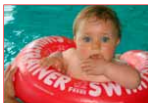
Meni je lepo.

Plavalna zveza Slovenije organizira vadbo v vodi za dojenčke in malčke (od 6. meseca do 4. leta starosti), ki poteka v Termalnem parku na Ptuju. Vadba se začne 4. oktobra. Uvodno predavanje za starše bo v petek, 30. septembra, ob 18. uri in sejni sobi apart hiše v termah. Informacije in prijave na telefon 051 220 984.