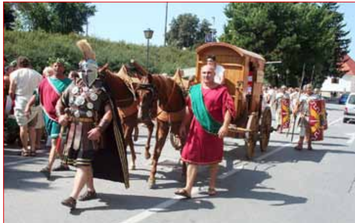
V rimski povorki je sodelovala tudi reprodukcija kočije poljske skupine iz Kališa, najstarejšega poljskega mesta.