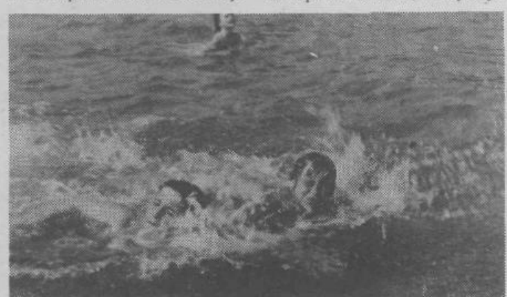
Neplavalci niso spoznali strahu pred vodo, plavalci pa so se poskušali že kar z mojstrskimi zamahi

Vsa ta razmišljanja o življenju otrok na letovanju izvajalec ZVEZA PRIJATELJEV MLADINE dobro pozna in razvija že več let. Zato organizira letovanje v počitniškem domu v ZAMBRATIJL.