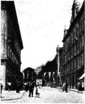
Vhod na „Mariborski teden“ 1935.