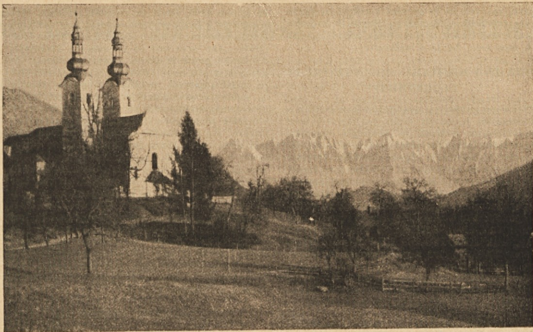
Marijina romarska cerkev v Maria Rein na Koroškem. V ozadju naše planine. Naši predniki so v živi veri svetišča Bogu in Njegovim svetim v čast postavljali na najlepših krajih

stus vsaj tako trdno izkazan kot katera koli zgodovinska osebnost, katere nihče ne taji. Sicer na danes zanikujejo Kristusovo zgodovinsko resničnost le še kakšne materialistične neznanstvene knjižice, ki so pisane za popolnoma neizobražene ljudi. Ruske komunistične brošure tajijo Kristusa, seveda le zato, da spodmaknejo temelj veri vanj.