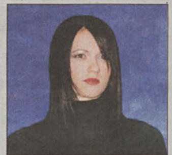
... ob odhodu