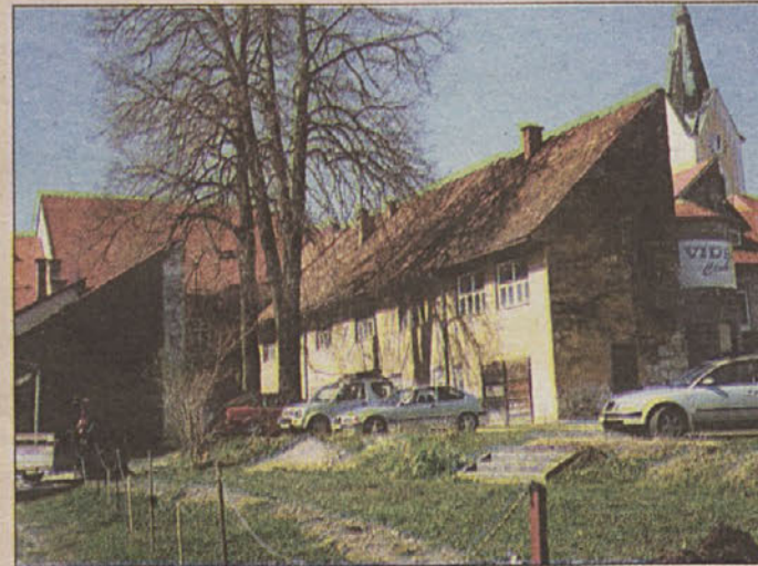
Tu bo zrastle hiša za državne uradnike.

nik, ki pa ga tokrat bolj zanimajo cementni proizvodi in menda ne bo uporabljal globoškega peska. Se bo za rudnik zato odločilo podjetje iz Ljubečne? Tako kot sta Romih in Boste smelo postavila razvoj Agrariacvetja in se namesto rož odločila za vrtnine. V Brežicah pa bo po ponedeljkovi seji občinskega sveta mo-