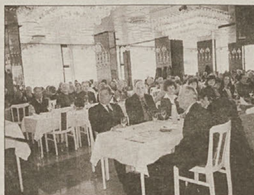
Z zbora diabetikov na Motelu Petrol Čatež