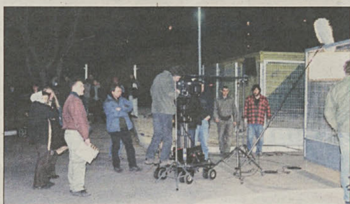
Takole pa izgleda nočno snemanje na speedway stadionu.

“Rezervnih delov” s filmi zadnjega desetletja kaže, da gre za enega najbolj težavnih in zahtevnih projektov, katerega vrednost je ocenjena na preko milijon evrov.