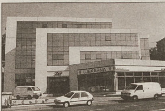
Eden izmed večnamenskih poslovnih objektov, ki jih je Togrel zgradil v Zagrebu. S pridobljenimi deli v tujini lahko ohranjajo in celo odpirajo nova delovna mesta.

Dve podjetji, ki izvajata grabbena dela na ZD Krško in OŠ Senovo, imata svoja sedeža na Dolenjskem oz. Štajerskem, kamor se razporejajo tudi vsi davki in drugi prispevki zaposlenih. To za krško gospodarstvo in prebivalce gotovo ni dobro in vsekakor ne nepomembno. Še bolj narobe pa je, da se praktično s tako pridobljenimi sredstvi iz Krškega lahko ohranjajo in celo odpirajo nova delovna mesta drugod, zadostno financirajo razna kulturna, športna in druga društva, v Posavju oziroma v Krškem pa se očitno nikomur izmed "poklicanih" ne zdi potrebno na takšen način pomagati odpirati nova delovna mesta v domačem okolju ter financirati prav tako številne občinske ali regijske družbene – civilne ustanove. AF