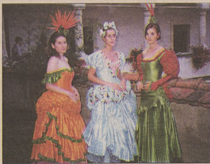
...in festivalske hostese

Kot je znano, je ustavno sodišče pred 14 dnevi zavrnilo pobude za začetek presoje ustavnosti in zakonitosti vladnega sklepa, ki so jo 18. februarja na ustavno sodišče vložili predstavniki iniciativnega odbora za ustanovitev novih občin. Pobudnice pa so že takrat napovedovale vložitev ustavne presoje na odločitev DZ. Takrat je državni zbor izmed 50 pravočasno in pravilno vloženih predlogov za nadaljevanje postopka za ustanovitev novih občin in določitev njihovih območij podprl le tistega za ustanovitev nove občine Smartno pri Litiji. S.V.