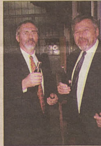
Začelo se je s coca colo.

Dobovčani, ki znajo ostati brez svoje občine, bodo zaradi bližnje meje namesto tega dobili vsaj najsodobnejšo železniško postajo in tako težko pričakovani podhod. V Opekarni upajo, da se bo v obliki anhovskega Salonita vrnil njihov prvi last-