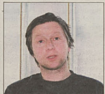
Režiser Damjan Kozole

Filmsko ekipo, ki se bo v Posavju zadrževala dober mesec in pol, smo obiskali šesti snemalni dan, skupaj je predvidenih 56 snemalnih dni. Scenarist in režiser Damjan Kozole