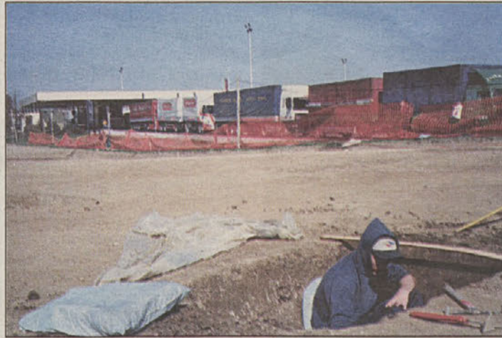
Arheološka izkopavanja na Obrežju presenečajo tudi strokovnjake.

vojaške opreme in keramike, znotraj utrdbe pa so odkrili tudi dve veliki krušni kupulasti peči. Več jih je še zunaj jarkov.