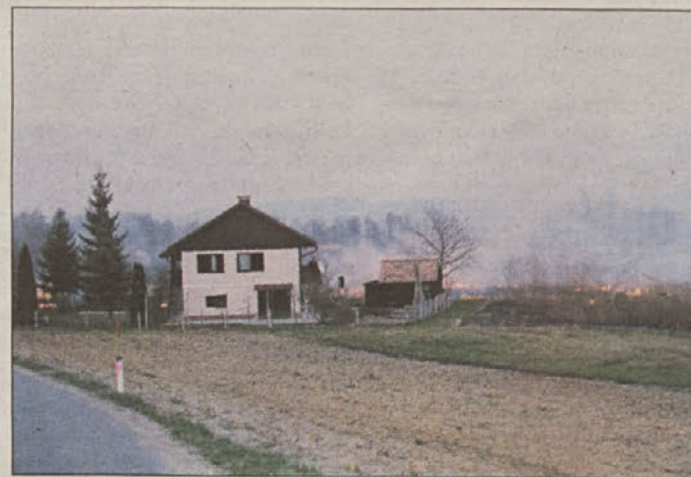
Kljub prepovedi spomladansko čiščenje na robu naselja Bizeljsko. Na istem mestu je v prepovedanem času gorelo dvakrat.

Posavje - Republiška uprava za zaščito in reševanje je z 11. marcem do preklica razglasila veliko požarno ogroženost naravnega okolja na območju celotne Slovenije. V naravnem okolju je zato prepovedano kuriti, sežigati ali uporabljati odprti ogenj, puščati ali odmetavati goreče predmete ali snovi oz. predmete ali snovi, ki lahko povzročijo požar.