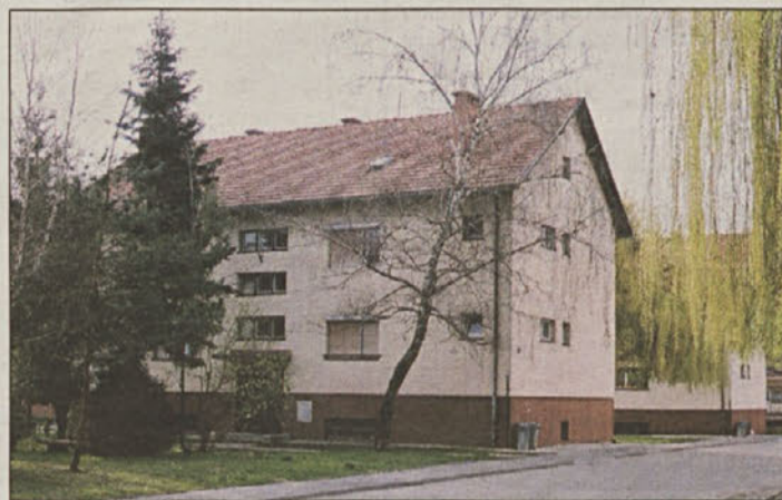
Vojaška stanovanja samevajo, prosilci na občinski listi pa čakajo.

Načrtovani programi, ki jih na MORS pogojujejo z reorganizacijo SV, dajejo malo upanja za reševanje stanovanjske problema okoli 30 čakajočih na listi, ki je