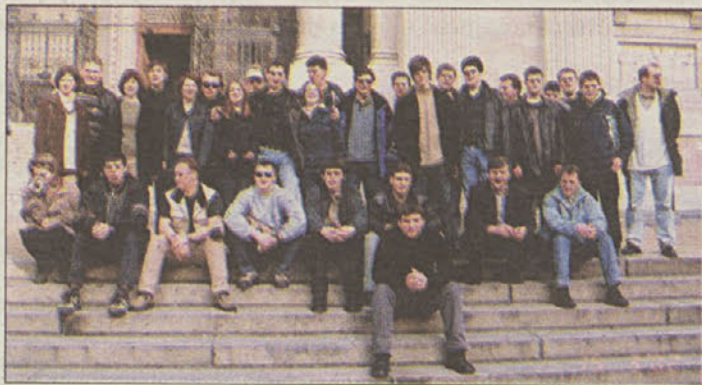
Pihalni orkester pred baziliko v Budimpešti

zahtevne koncertne skladbe in skladbe zabavnega žanra. Že naslednje leto pa bo madžarski pihalni orkester ponovno gost v Sloveniji, v Kapelah. S.V.