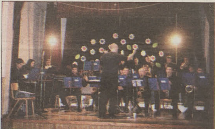
Prepolno dvorano TVD Partizana v Boštanjju so navdušili s svojo zavzetostjo in energijo, ki so jo prenesli na lepih zvokov željno poslušalstvo.