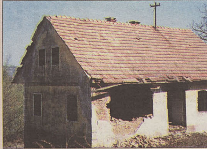
Prva hiša bo padla.

naenkrat se sprožajo vprašanja o smotnosti del, češ, kako draga bo energija, in v javnosti so prišli celo pomisleki okrog hlajenja nuklearke ob dograditvi verige elektrarn. Predvsem v brežiški občini, kjer bo zaradi gradnje avtoceste padlo nekaj hiš, prva pa že čaka na svoj žalostni konec, upajo, da do političnih veriženj ne bo prišlo.