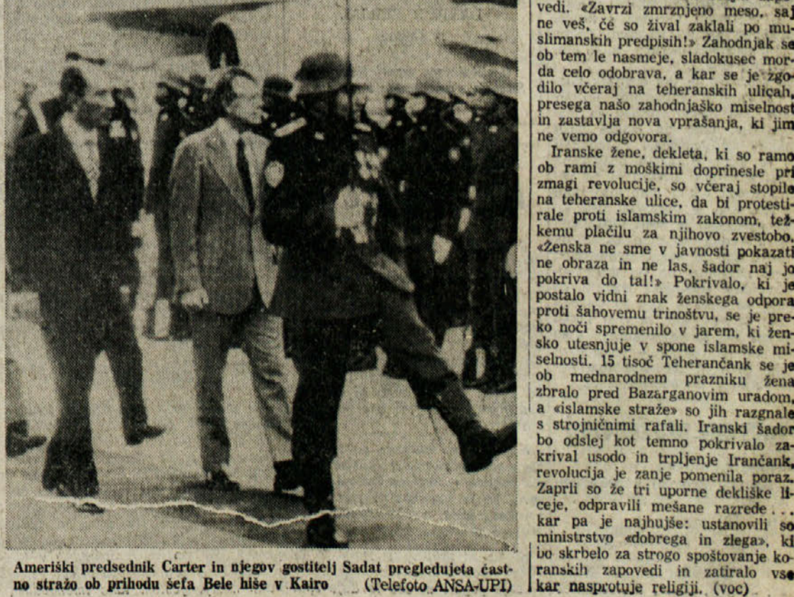
Ameriški predsednik Carter in njegov gostitelj Sadat pregledujeta častno stražo ob prihodu šefa Bele hiše v Kairo