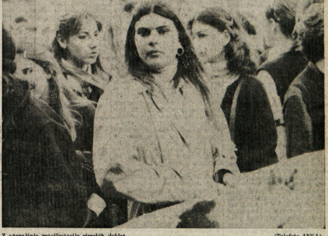
Z večernje manifestacije rimskih deklet