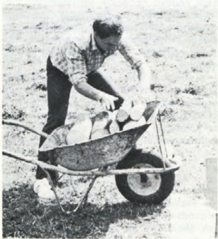
Vožnja samokolnice s poleni