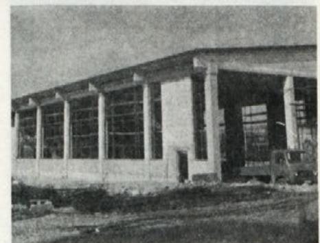
Avtodelavnica v Izgradnji.