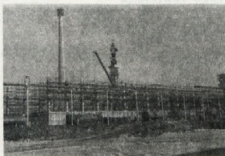
Izgradnja S kisline vidno napreduje