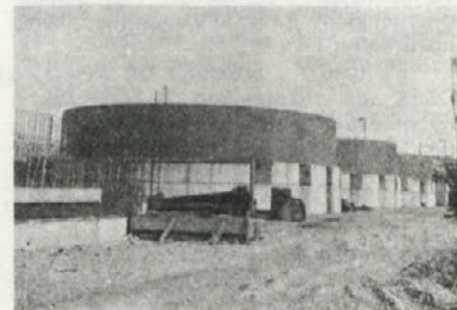
Poleg nove kisline rastejo rezervoarji