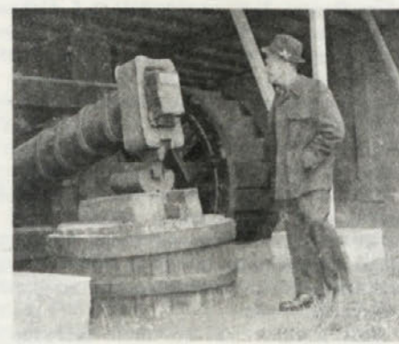
Pred muzejem Železarstva je razstavljeno mehansko kladivo »Repač«