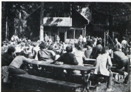
Srečalo se je več kot 500 sodelavcev