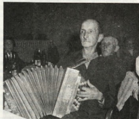
Za vedro razpoloženje je kot vedno doslej skrbel naš znani harmonikar