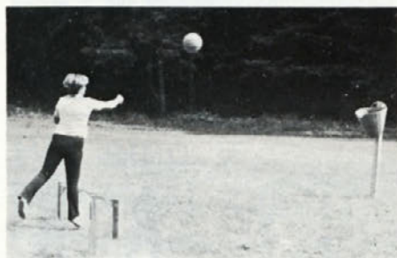
Bo šlo v koš?