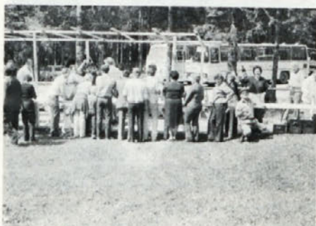
Kuharska ekipa in vrsta pred njo