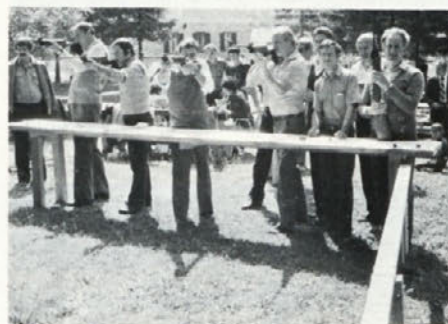
Strelci so se zvrstili pred tarčami