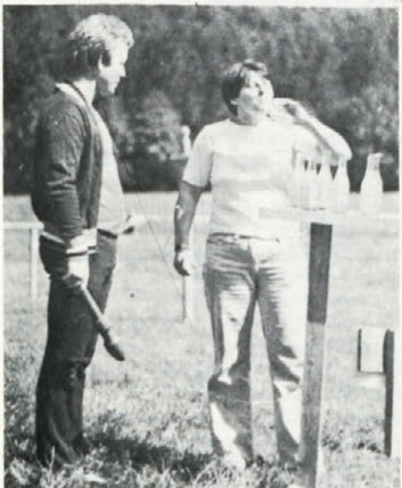
Prisiljeno pitje je nekaterim delalo težave!

Zadnjo soboto v avgustu smo imeli Cinkarnarji množično športno rekreacijsko srečanje v Logarski dolini, prvo večje srečanje po letu 1973.