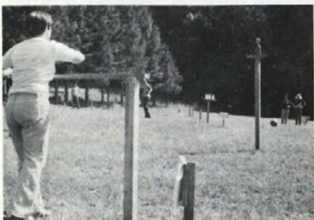
Najtežja naloga - zadetek lutke