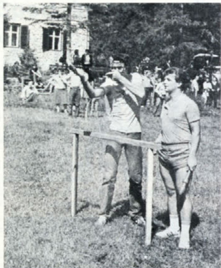
Ali bo zadel balonček?