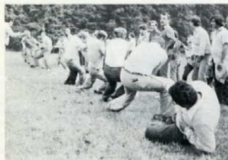
V vlečenju vrvi so se pomerili mnogi težji moške!