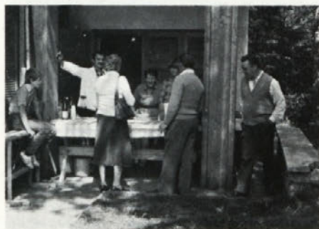
Tudi okrepčilo je bilo potrebno