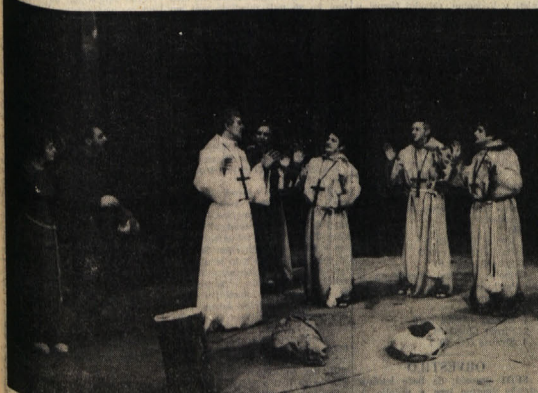
Prizor s sinočnje premiere v Kulturnem domu. Obširno poročilo objavljamo v tržaški kroniki