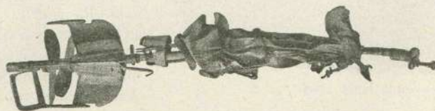
Torpedo po eksploziji.