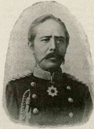
Japonski general Kuroki.

pesmi v novodobni prepesnitvi; Kralik jih je obnovil tako mojstrsko, da jih je priporočati vsakomur, ki se zanima za te impozantne pesnitve o preseljevanju narodov.