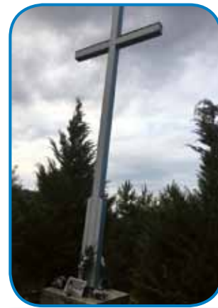
Svetlobni križ se zdiga nad vesnicov