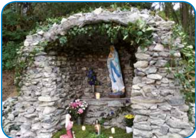
Voilina Lurdske Marije

tapravo, ka mo ofer dali v sklad Mindszenty, steroga je škof ustvauro nej dugo nazaj, ka bi pomago tistim, steri bi se