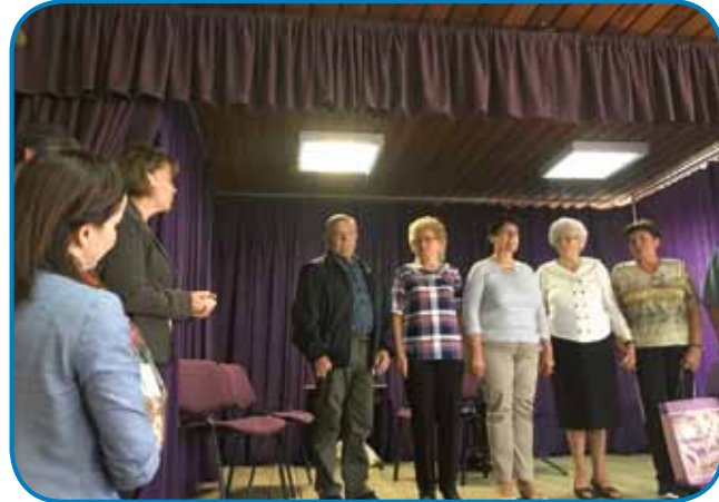
Gledališki družina Nindrik-indrik se zavali za aplavz

22. septembra je Slovenska samouprava Števanovci organizirala gledališki zadvečerek, na steroga je pozvala več skupin. Zavolo toga, ka