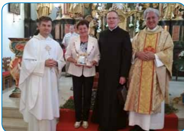
ROMANJE V SV. JURAJ NA BREGU NA ROVAČKOM stran 6-7