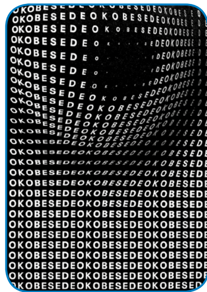
Posebej zanimiva naslovnica brošure in plakata, ki je opozarjal na Oko besede