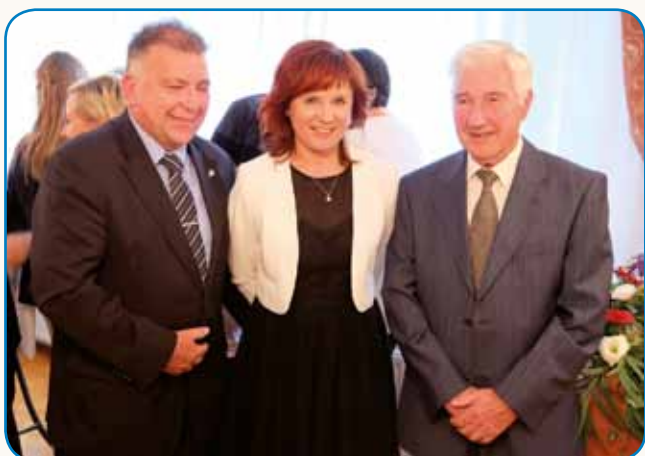
»ŽELIM PRIBLIŽATI SLOVENIJO PORABCEM IN PORABJE SLOVENCEM« stran 3

SVOJO ŽIVLENJE NE RAVNAMO VSIGDAR MI: KONČNI CILJ JE LÜBEZEN