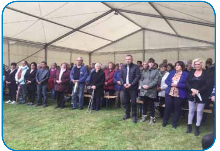
Šator so napunili verniki, steri so prišli iz cejluga Porabja