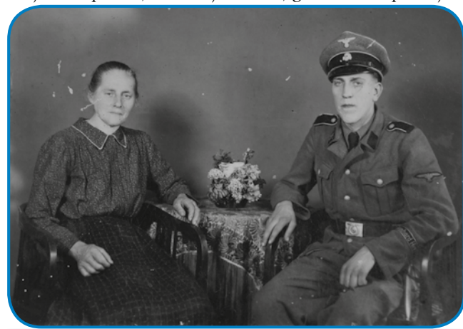
Tetica Roza s sinaum, steri je slüžo kak nemški sodak

mati mlado mrla, verstvo je pa velko bilau, tak je tau baja bila.«