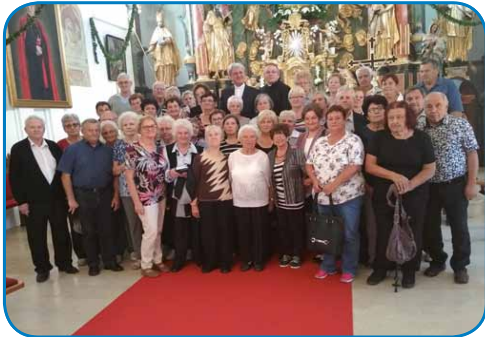
Porabski romarje v cerkvi Sv. Jurina na Bregu

v 11. vöri začnila s procesijo. Mešo je slüžo novomešnik z 10 dühovniki. K meši je tak dosta romarov prišlo, ka so notri v cerkvi ranč mesta nej