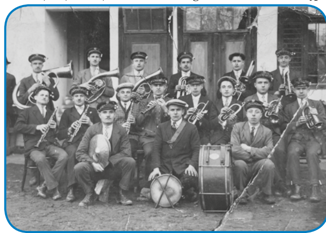
Na Gorenjom Seniki so gnauksvejta meli dvej velki bandi (pihalni godbi), v toj je igro Anim oče tō

gda je nam drüga tetica rágo (zvečilnega) poslala, mi smo pa nej znali, ka je tau. Mislili smo, ka vruga nam gumi pošilajo, vejpa tau je nej za djesti, zato ka te je tašo pri nas še sploj nej bilau. Sledkar, gda smo že znali, ka je tau, te smo ga tō odali, zato ka nam bola pejneze trbelo,