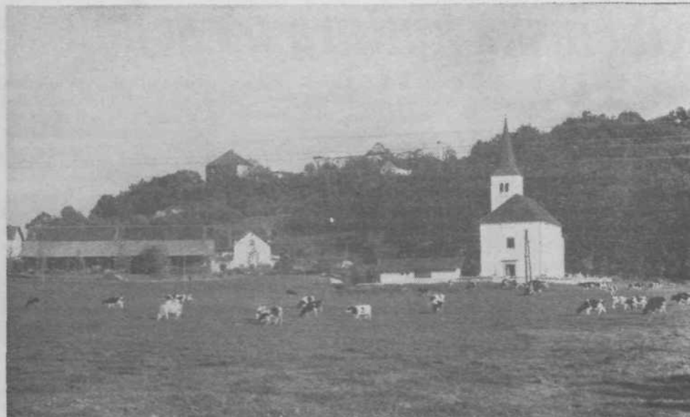
Poznojesenski prizor iz Mlačeva.

Pintarja in, pogovorom o ekologiji, naravnih in kulturni dediščini ter razvoju in obdaritvi krajanov, ki se lahko pohvalijo z več kot sedmimi krizi. Za otroke pa bo poskrbljeno v soboto, 21. decembra ob 17. uri na istem kraju. Obljubljajo, da bodo srečanje popestrili otroci šole Žalna in njihove učiteljice, vsi otroci bodo prejeli barvice in risalni papir in bodo na prireditvi ob igri tudi risali. Kaj bodo naredili, pa bomo lahko pozneje videli na razstavi. Na svidenje v V. Mlačevem!