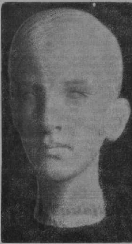
KIPEC IN RELIEF NJEG. VEL. KRALJA PETRA II.

Kipar Peter Loboda je po naravi na Bledu izdelal glavo Njeg. Vel. kralja Petra II. Plastika je bila posebno všeč blagopokojnemu kralju Aleksandru.