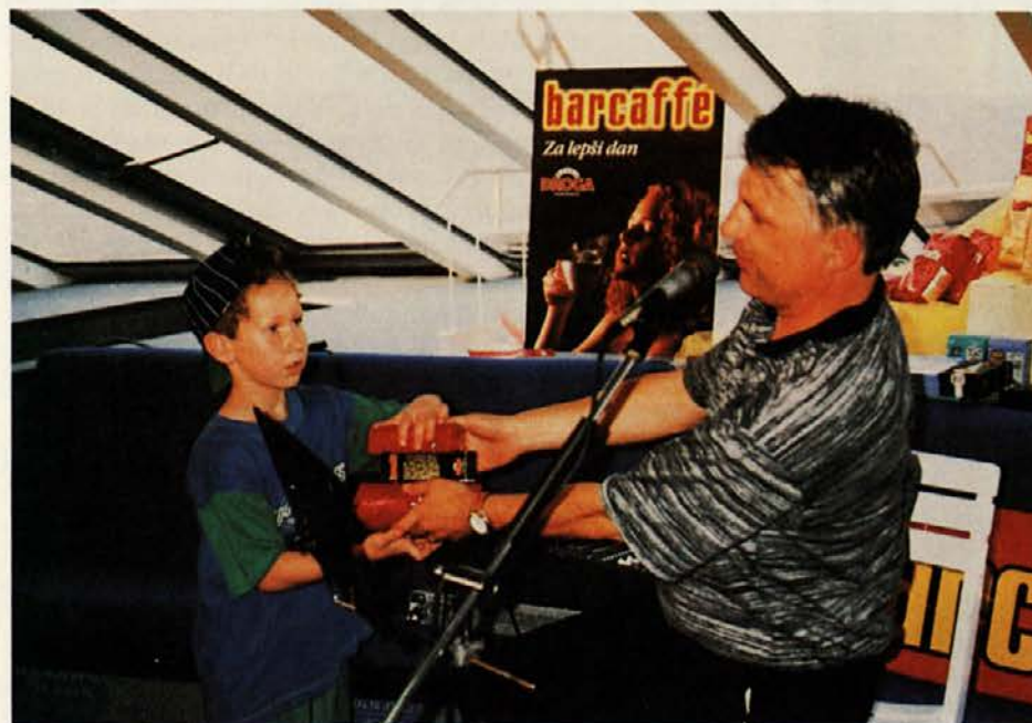
...in najmlajši potnik

Igra je bila zastavljena na principu prepoznavanja Droginih vakuumsko pakiranih kav. V štirih tednih, kolikor je igra potekala, so bile bralcem dnevnika Večer predstavljene štiri vakuumsko pakirane kavne mešanice Barcaffè: Filter, Light, Espresso in vakuumsko pakirana kavna mešanica v rdeči embalaži. Sodelovanje v nagradni igri je bilo vezano na nakup vakuumske kave, saj so bralci, ki so želeli poslati odgovor v uredništvo, morali kuponu priložiti črtno kodo, ki je natisnjena na embalaži izdelka. Zato je bil odziv nekoliko manjši, kot bi bil v primeru, da bi za sodelovanje v igri zadostoval le odgovor na kuponu. Pa vendar je v uredništvo prispelo več kot sedem tisoč odgovorov.