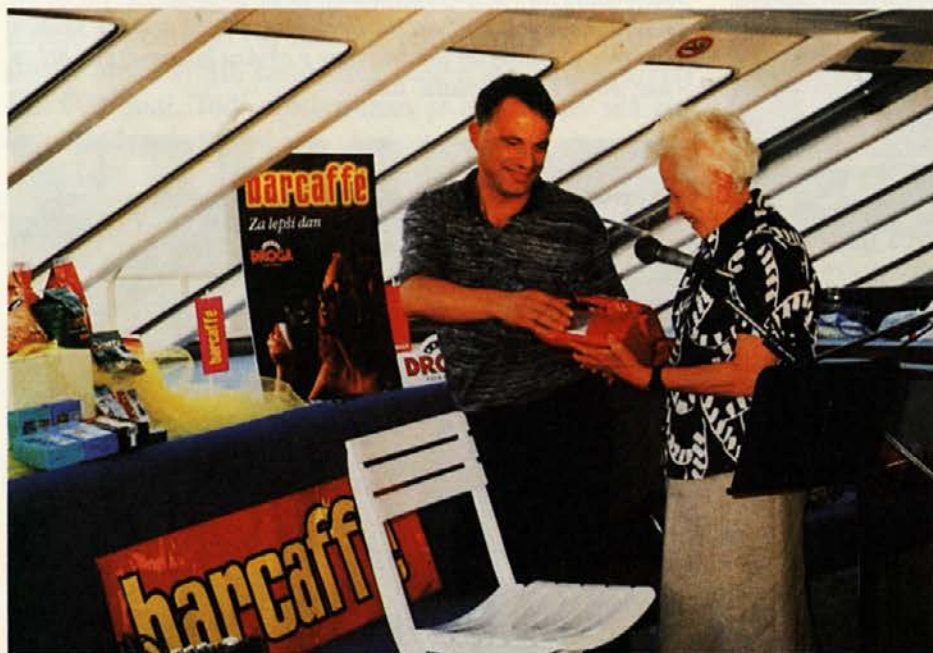
Pot iz Benetk proti domu so popestrila nagradna vprašanja in izjeme med nagrajenci. Kot posebno priznanje za udeležbo pri igri sta kavo Barcaffè prejela najstarejša potnica...

Drogina nagradna igra "S kraljico kav v Benetke", ki je potekala maja v sodelovanju z mariborskim Večerom, je zaključena. Prince of Venice je 8. junija popeljal na ogled Benetk 296 nagrajencev (148 izžrebanih s sopotniki), že med samim potekom igre pa je Droga Portorož podelila 104 kilograme kave, to je 26 izžrebanecem vsak teden.