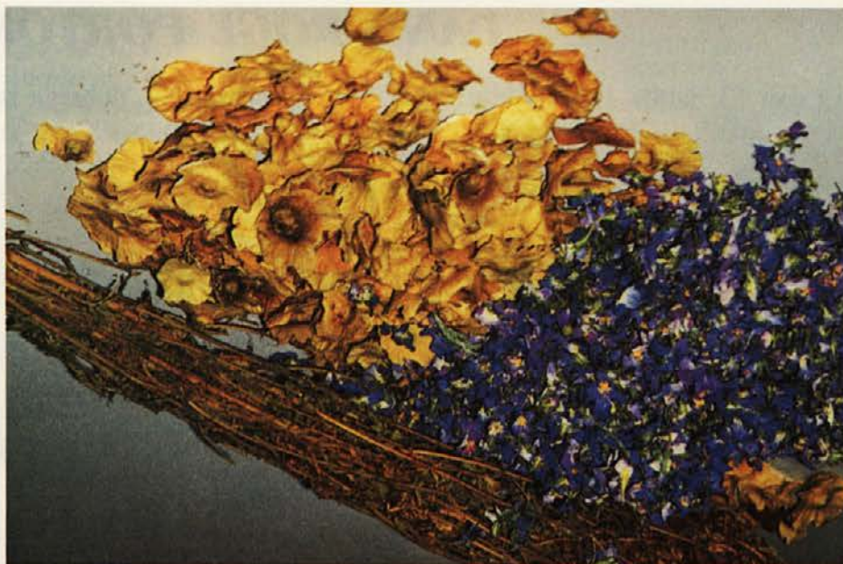
Plod Kristusovega trna, cvet slezenovca in rastlina močverskega oslada se predstavijo

njegovem kolesju in nekatere odločitve glede odkupa je bilo treba hitro sprejeti; morda so bile sprejete celo za spoznanje prehitro... Zelišča in gobe tako niso več najmočnejši izvozni artikel, ker jim je strategija družbe pač namenila drugačno mesto in ker nismo več brez konkurence. Tudi nasploh je prodaja zelišč v Evropi padla za skoraj polovico, ponekod jo ovirajo novi, "zeleni" lokalni predpisi o zaščitenih vrstah (in rastline, ki je v neki državi zaščiten, "worldwide" ni mogoče uvoziti od drugod). Droga potrebuje nekatera zelišča v svoji proizvodnji čajev in začimb ter oskrbuje več slovenskih porabnikov zelišč. Na ta način še vedno lahko nudi v izvoz določene količine nekaterih vrst. Poleg tega imamo na tem področju široko poznavanje materije, imamo tradicijo in sloves, katerega zeliščni trg ceni in ne pozabi čez noč, tako da se še vedno obrača na nas, četudi je naša informacija o zmanjšanju asortimana že davno obšla vse kupce (nekateri so jo sprejeli z velikim obžalovanjem, saj smo bili mnogim ne samo največji, ampak celo edini dobavitelj). Če ne bi zvenelo preveč solzavo, bi lahko rekli, da to tradicijo zdravilnih zelišč moramo gojiti - to dolgujemo mlajšemu rodu. Seveda ne bo šlo brez