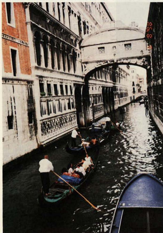
Nekateri so se odločili za sprehod z gondolami (slika k članku na st. 11)