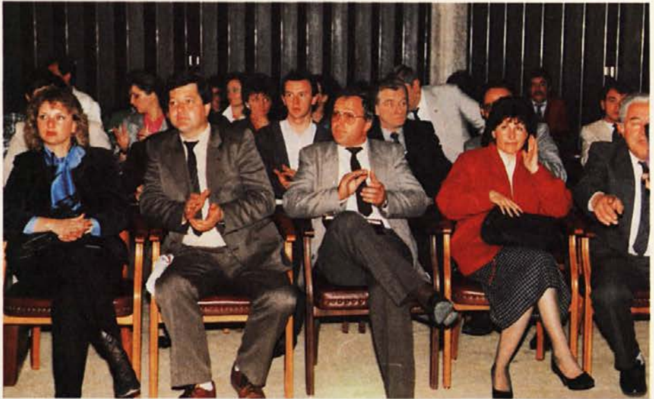
Star pregovor pravi, da ne moreš zboleti, če ti na vrtu cveti zjubej

Po razpadu Jugoslavije je sledila vojna na ozemlju med Slovenijo in Srbijo ter ogrozila ves cestni in železniški transport, sesul se je plačilni promet, vse te razmere so ovirale tudi zbiralce, ki so bili, kljub težkim razmeram, še vedno pripravljeni sodelovati in narediti, kar bi se pač dalo. V Sloveniji pa so se medtem odvijali novi gospodarski procesi (med njimi lastninjenje), ki so čez noč postavili pogoje tržnega obnašanja; koliko manj bi bili lahko rigorozi in kdo vse si je tedaj v slovenskem gospodarskem in političnem prostoru mehko postlal na račun nove situacije, bi zdaj ne govorili. Dejstvo je, da je bilo Drogi nenadoma otežkočena oskrba z večjimi količinami zelišč, saj je postal ves Balkan zelo negotov dobavitelj, med nas in področja nekdanje Jugoslavije so se čez noč postavile tudi uvozne dajatve. Še več: drug za drugim so padali vzhodnoevropski politični sistemi, novonastali privatni sektor je odprl vrata zahodu in mu po-