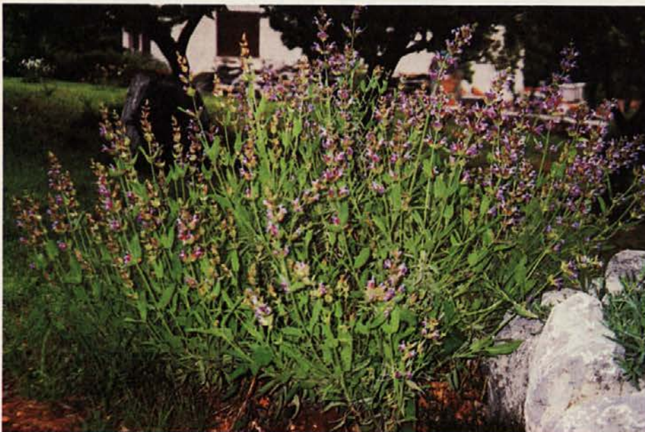
Kje so že tisti časi... (Tak je bil cvet nekdanjega odkupa.)

Danes gospodarstvo pri nas neizprosno ukazuje ustvarjanje dobička: ali tako ali nič! Droga se je znašla v