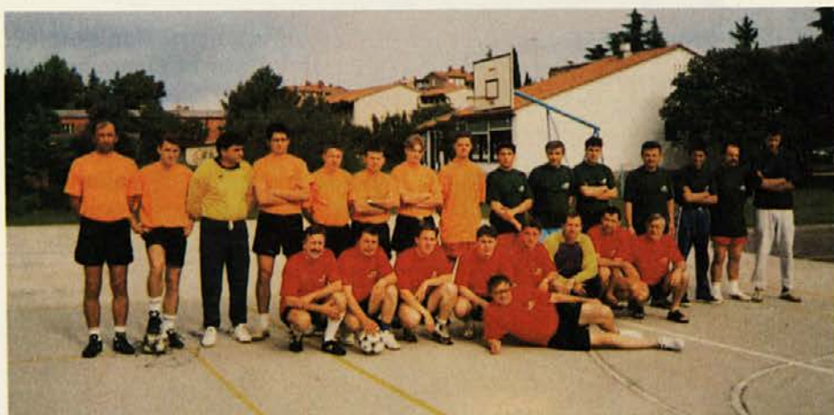
Fantje na levi predstavljajo ekipo Argo I, ob njih na desni stojijo nogometaši Argo II, čepijo fantje ekipe AOP.