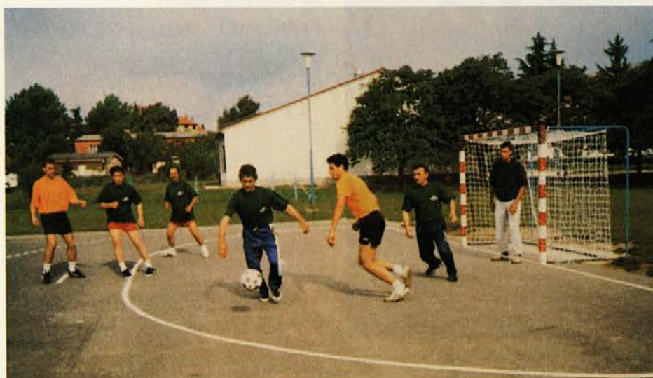
Akcija, ki je tekla tik predno je padel prvi gol.