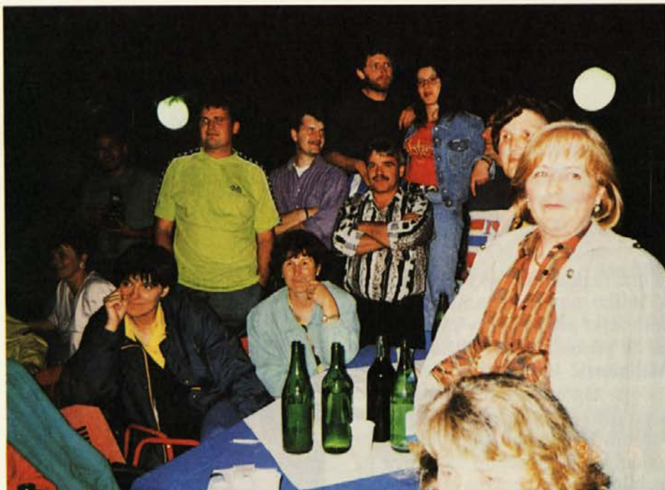
V pričakovanju novih, veselih presenečenj.