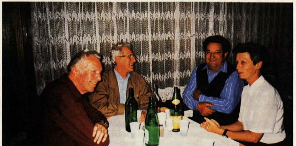
Naša Danica iz Gosada v družbi z našimi upokojenci.