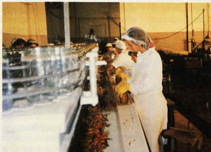
Feferoni na poti proti cilju - kozarcem

V PC Gosad smo pred leti lahko govorili o pričetku sezone pridelave vrtnin, danes pa to delo teče skozi celo leto. Spomladi se začne le predelava sveže zelenjave. Kmalu pa bo tudi ta potekala celo leto, saj veliko vrtnin gojijo v rastlinjakih in klasični začetek sezone ne bo več datumsko opredeljen.