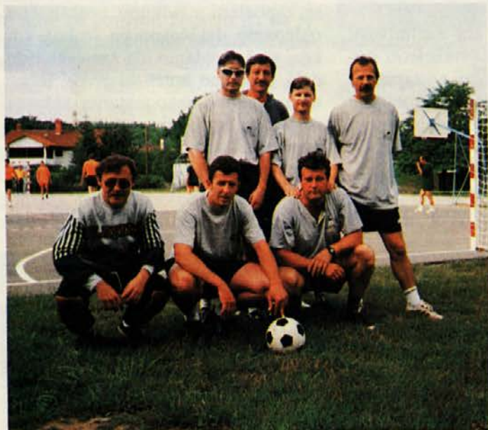
Nogometna ekipa Začimba. Malo so zamudili, zato foto posebej. Se pač zgodi...

Nekako ob pol desetih se je pričela tekma med tremi odbojgarskimi ekipami. Igrali so mešano - sodelavci in sodelavke. Slednje je kaj nepomembno, bolj pomembno je, da so tri ekipe dodobra segrele že tako vroč pesek na portoroški plaži.