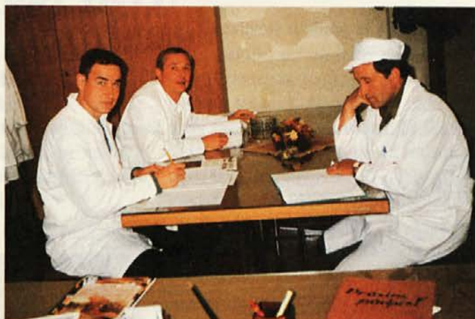
Brez sestankov pa res ne gre!

Naši delavci se tudi izobražujejo. Spoznavajo pravila varstva pri delu in požarno varnost. Tudi vzdrževalci so med prvomajskimi prazniki uspešno zaključili izobraževanje.