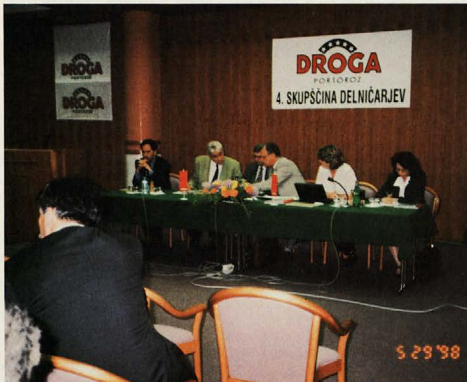
Delovno predsedstvo med skupščino

Zastavljeni cilji naj bi bili realni. So optimistični in upamo, da bodo tudi doseženi. V imenu delničarjev, ki jih zastopam, se delavcem in upravi Droge Portorož zahvaljujem za dosežene rezultate in dividende. Prepričan sem, da je to naša najboljša naložba.