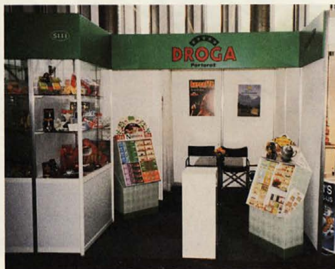
Drogin razstavní prostor na sejmju PLMA

Droga d.d. Portorož se je letos predstavila petič, tokrat s programoma, ki ju nedvomno najboljše obvladuje - s čaji in kavo. V prejšnjih letih smo predstavili tudi zelenjavni program in začimbe. Predvsem za zelenjavni program je bilo precej interesa, vendar se je izkazalo, da cenovno ne dosegamo nivojev, ki jih tak način trženja zahteva. Tovrstna proizvodnja se je namreč preselila v Bolgarijo in Turčijo, kjer so proizvodni stroški neprimerno nižji. Tokrat smo se osredotočili predvsem na čaje, saj je bilo zanje največ zanimanja. Predvsem pa je vzpodbudno to, da se določena povpraševanja ponavljajo, da so bolj razdelana, skratka, da so bili potencialni kupci zadovoljni s kakovostjo naših proizvodov. Nedvomno pa je potrebno vložiti še ogromno napora v sam proizvod, da bi ga lahko ponudili trgu takšnega, kakršnega zahteva. PLMA je lahko le prvi korak na tej poti. Nedvomno sta pomembni dejstvi neprestano naraščajoče število članov v PLMA in pa to, da predstavnikov vzhodne Evrope (še) ni v tem združenju. Spremljajoč pojav omenjenih trendov pa je pritisk in selitev t.i. trgovskega kapitala izven meja EU. Z njim pa se bodo nedvomno selili tudi dobavitelji v posameznem sistemu.