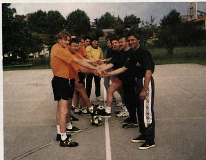
Prva tekma, prvi športni pozdrav sodelavcev v drugi vlogi...

Na igriščih za tenis na Bernardinu je bilo lepo vreme, igralci pa so bili zaverovani v igro in so igralca. Kakšnega posebnega vzdušja ni bilo. Vsaj spodaj podpisani se je tako zdelo. Morebiti je za njimi naporen teden ali pa so pogrešali bolj