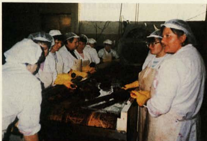
Peso je treba najprej očistiti

V našem PC pa se vseeno marsikaj dogaja. V proizvodnji dela potekajo nemoteno. Pripravljamo se na prihod novih delavcev, ki bodo začeli delati junija in na prihod srednješolcev in študentov, ki se nam bodo pridružili julija in avgusta. Letos bo veliko novih delavcev, saj bo veliko dela, ki ga bo treba opraviti natančno, kvalitetno in hitro.