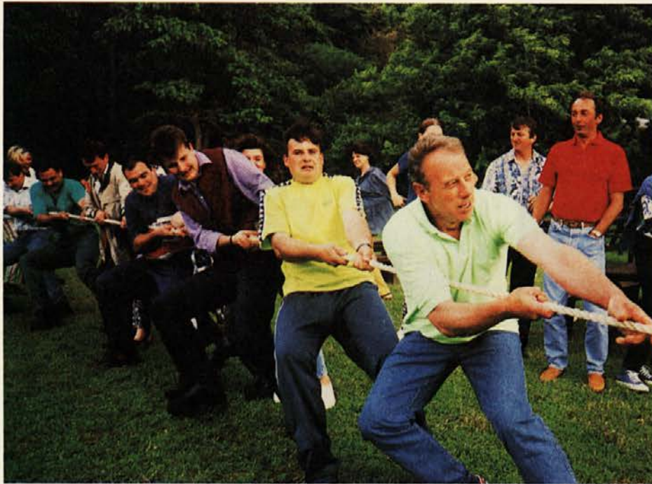
Ekipe zmagovalcev iz Zlatega polja. Pokala jim sicer niso kupili, a zmaga zato ni nič manj vredna.