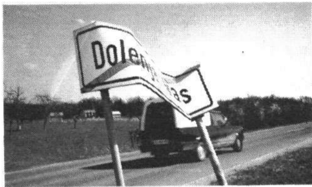
Pravijo sicer, da vedo, kdo je s traktorjem zvil tole krajevno tablo a nekateri natolcujejo, da je bila zadeva narejena organizirano. To bi namreč lahko bil prvi korak k (napovedani) združitvi dveh Dolenjih vasi: oni pri Starem gradu in oni pri Artičah. (Ika)