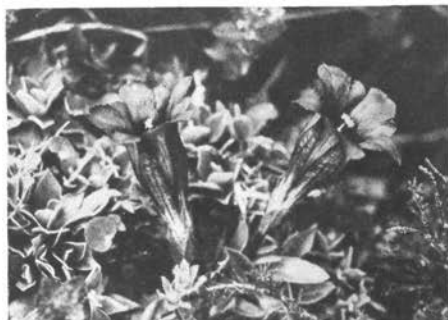
Zaspanček - Gentiana Clusii