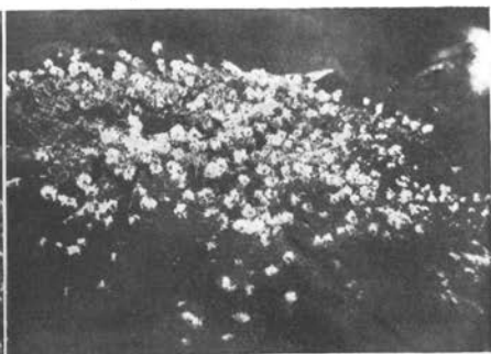
Lepnica - Heliosperma alpestre