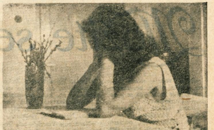
FRANCI KUHAR Kmet in zemlja

PRED SKUPŠČINAMI DOLENJSKIH ŠTUDENSKIH KLUBOV