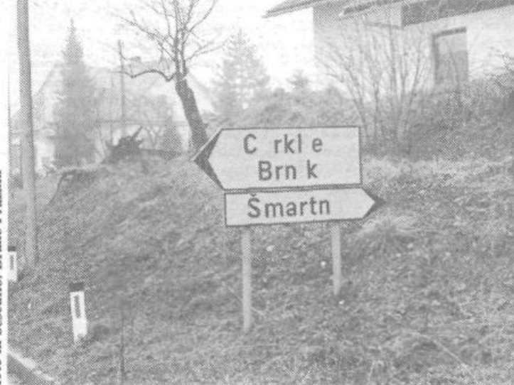
Še večje presenečenje pa vas čaka v Vodich, če boste hoteli nadaljevati pot v Cerkle ali na Brnik. Takšnega smernege napisa v Vodich ne boste našli, prav tako pa boste težko našli cesto proti Mengšu. Ob identificiranju teh napisov nam ni bilo jasno ali gre za vandalizem ali za izredno slabo izdelavo smerokazov.