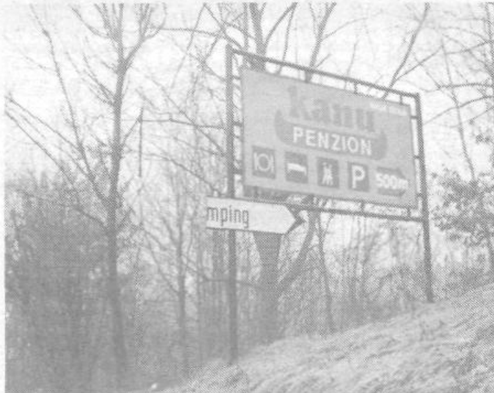
Res je, da pozimi ni veliko turistov, ki bi kampirali v Dragočajni, kjer premoremo edini prostor za te namene v občini. Zato odbiti smerokaz, ki naj bi kazal pot v ta konec, trenutno ni najbolj pomemben. Bojimo pa se, da bo takšen napis ostal tudi poleti, ko bo na sončno stran Alp prišlo nekaj več tujcev.