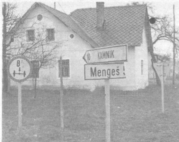
Takole razbitih in poškodovanih smerokazov je v naši občini še nekaj ducatov. Zbrali pa smo samo nekaj »vzorcev« našega vandalizma. Tam pri sosedih, kjer naj bi bila po logiki senčna stran Alp, tako uničenih napisov nimajo, zato pa imajo več zadovoljnih turistov in večji turistični dohodek.