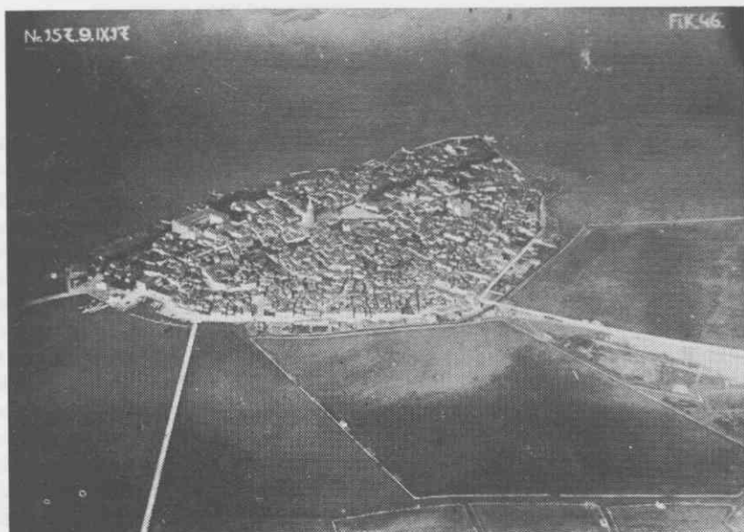
Koper, zračni posnetek 9. septembra 1917

vilne diapozitive, narejene po lastnih fotografskih posnetkih. Časopisno poročilo o Vertinovih napovedih zveni silno sodobno, kot da bi čitali današnje ocene o oboroževanju sveta. 3