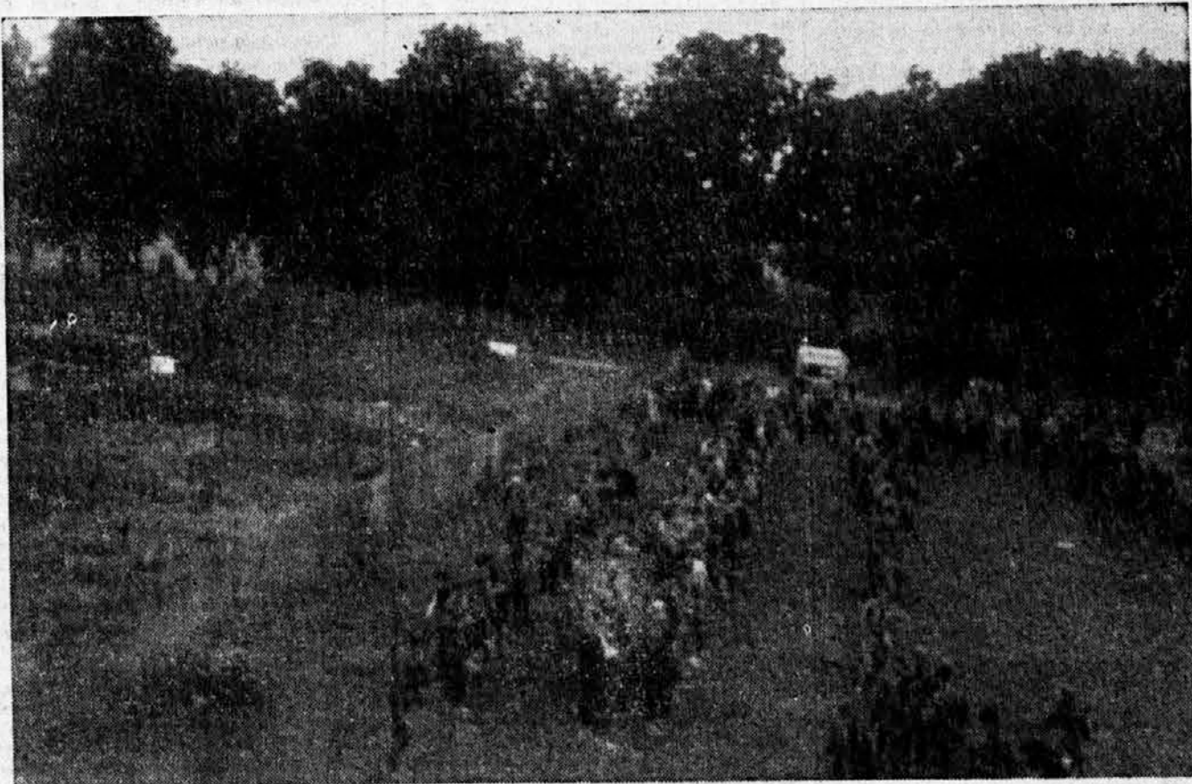
Spredej vrsta tolovažev s puškami in strojnimi, zadaj enaka vrsta, v sredi dvakrat zvezani nedolžni Slovenci — tako je delal brat z bratom septembra 1943

To pojasnilo smo napisali zato, da ne bi zavodu delali krivice, da ne bi bila javnost napačno poučena in da ne bi irrpelo vpisovanje za novo šolsko leto, ki je ravno te dni na zavodu.