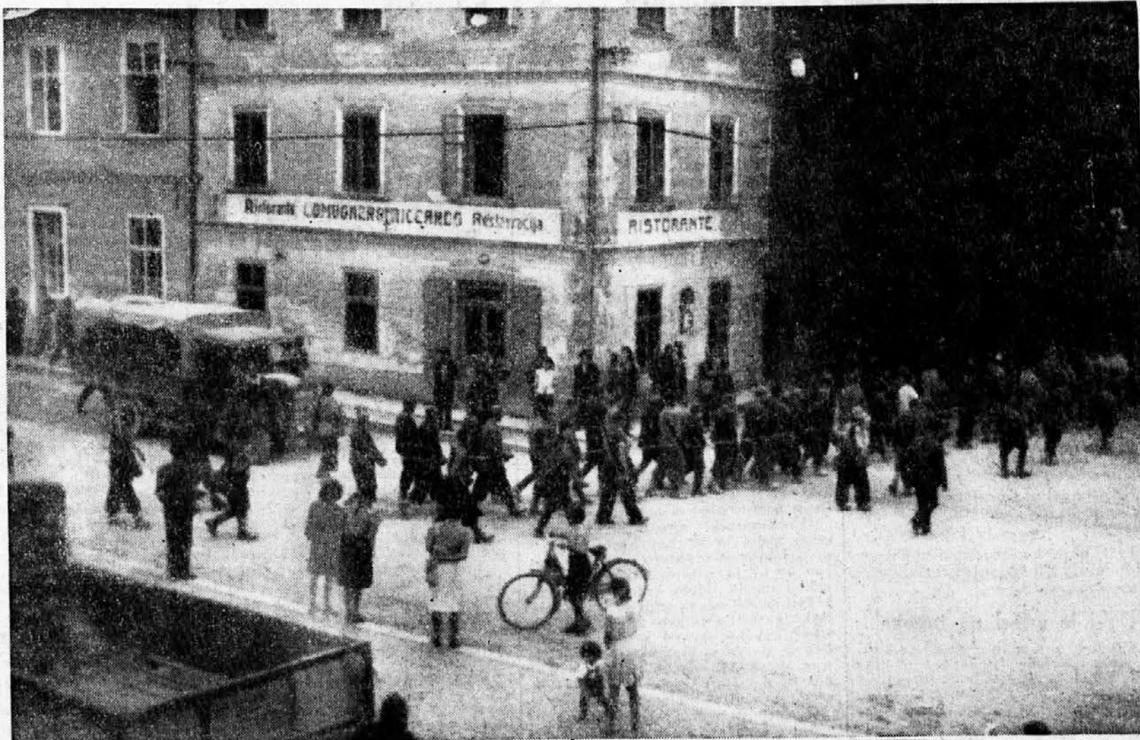
12. september 1943: z zvezanimi rokami, po vrhu še navezane na žlco kakor živino, ženo rdeči tolovaži jetnike z Grčarice v kočev- ske zapore, zadnjo postajo pred strašno smrtjo, potem ko sta Kidrič in Vidmar silovito razglasila amnestijo in zagotovila življenje vsem, ki se podajo »narodno osvobodilni« vojski. Ta slika je eden najbolj neizpodbitnih dokumentov v tem, kako je rdeči »brat« z ravnal lastnim slovenskim bratom, ki je zaupal komunistovi besedi. Kje je agitacija, ki bi mogla to resnico spravi- titi a sveta?

Oni iz OR tabora, ki se ne mešajo v politiko in sedijo lepo na varnem v Ljub-