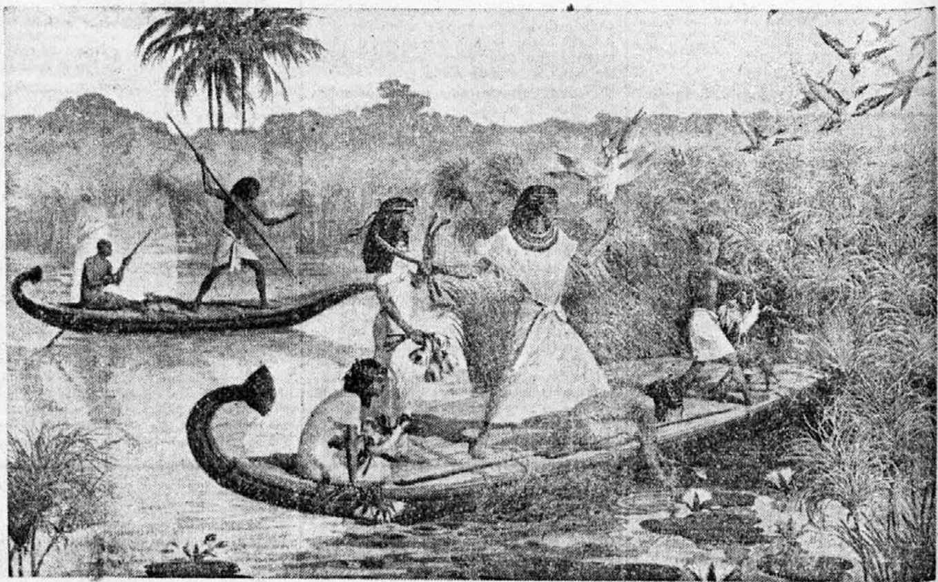
Dvorjan in svečenik Menena se je z svo družino odpravil v Nilovo porečje, kjer se zabavajo z lovom na divje rase in druge vodne ptice. Lahni čolni se motajo v močvirnem tratiščju, dvorjan ima v rokah mladičad približa. Njegova žena mu ponuja ukrivljene palice iz težkega lesa, ki jih bo lovec čolnu vidimo vlna, ki s posebno sulico čaka na debele, drsteče se rihe. Vse porečje je znani štari Egiptanci tako spretno izrabljali, naj bo za pisanje ali pa za gradbo

kakor pri vseh drugih vojskovodjih, temveč okronanje vsega njegovega političnega dela, opravilo njegovega nenavadno oblastnega stališča napram senatu, napram narodnemu izročilu in napram javnemu mnenju. Le velik vojsko političen uspeh, katerega potrjujejo očita zunanja znamenja, bi omogočil odpusčenje za to, da se je na tako nagel način znebil svojega trilmvirskega tovariša. In te tedaj, ako se mu posreči vcepiti v srca Rimljanov prepričljiv občutek, da je on sam nenadomestljiv, sme računati s tem, da ga bodo še naprej imeli v čislju in ga pustili na oblasti. Kratko in malo, Kleopatra je bila zanj stopnica, po kateri je mislil priti do najvišje vladarske časti. Zaradi tega je budno pazil, da ne bi pretgal vezl, ki so kraljico še priklepale na življenje. Dal je celo prositi, naj vendar zapusti mrko grobišče, kajti po Antonijevem pokopu zanjo nima nobenega smisla več, da bi še tam ostala. Povabil jo je, naj se vrne na dvor, kjer se bo pozdravila in bo uživala vse časti, kakršne pristojajo njenemu položaju. Samo jo bo čimprej obiskal. Kleopatra si ni nič bolj vroče želela, kakor ponovno zavzeti svoj stari položaj in priti z zmagovavcem v osebn stik. Le prvega koraka ni hotela storiti ona, da ne bi ustvarila videza, kakor da prosi milosti. Toda tedaj je prišel Oktavijan sam, izrazil željo, da bi jo raz videl, ter ji napovedal svoj obisk. Tudi Olympos jo je kot zdravnik nagovarjal, naj zapusti svoje bivali-