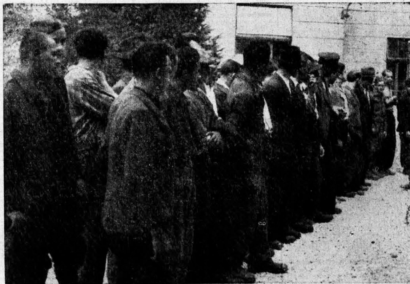
Takole svobodno in prostih rok pa pripovedujejo v Ljubljani svoje storiže tolovaži, ki so jih domobranci zajeli v bojih avgu- sta 1944. Navzile Turjaku, Grčaricam, Mozlju, navzile razdejani domovini in uničenim domovom vidli domobrance v tolovaju, ki se vda, še vedno jetnika, to je človeka, ki ga ne gre pobijati kakor žival. In kako delajo »osvobodilci« z zajetimi domobranci!