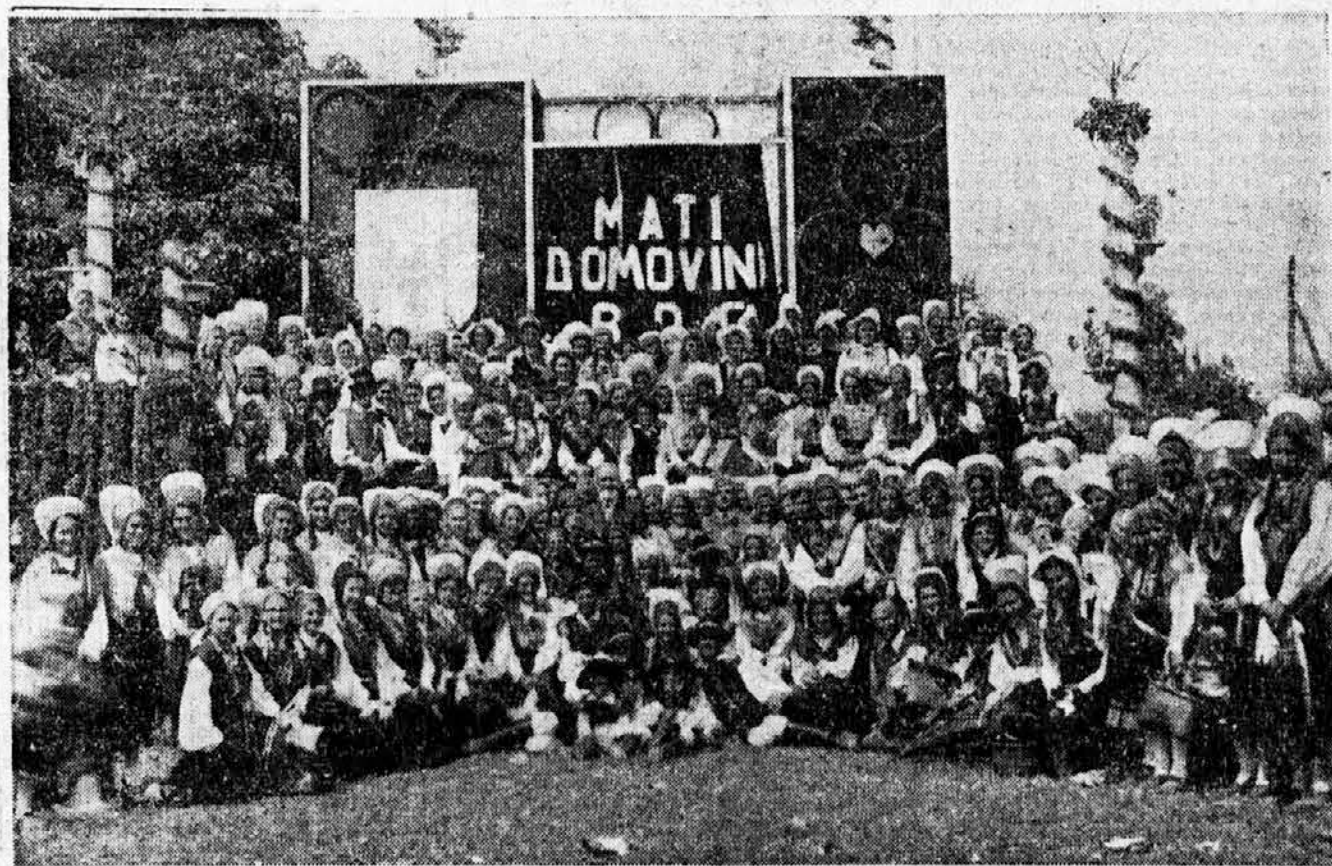
Unsere Volkstracht — unsere Schönheit, — Naša narodna noša — naša lepota