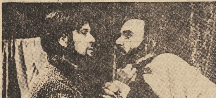
Prizor iz TV-filma »Bratje Karamazovi« (Režiser Sandro Bolchi). Film je bil posnet v okolici Novega Sada.

ki ga v nadaljevanjih posreduje slovenskim gledalcem RTV Ljubljana, vzbuja zanimanje za avtentični tekst, po katerem je bil film posnet. Slovenski prevod romana je izdala DRŽAVNA ZALOŽBA SLOVENIJE: