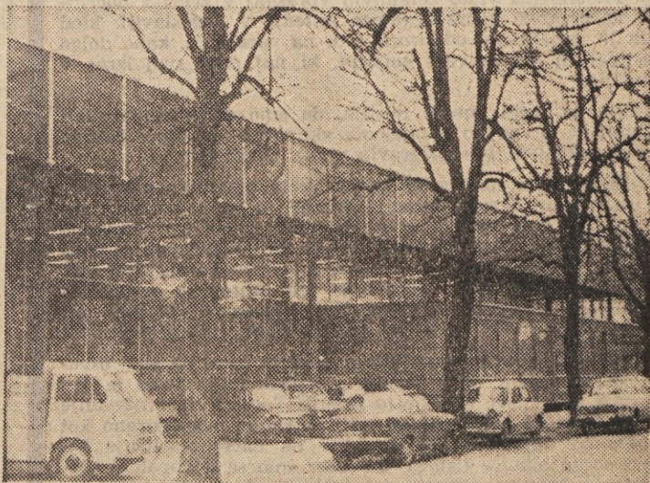
Novo poslojpe Kemofarmacije v Metelkovi ulici v Ljubljani