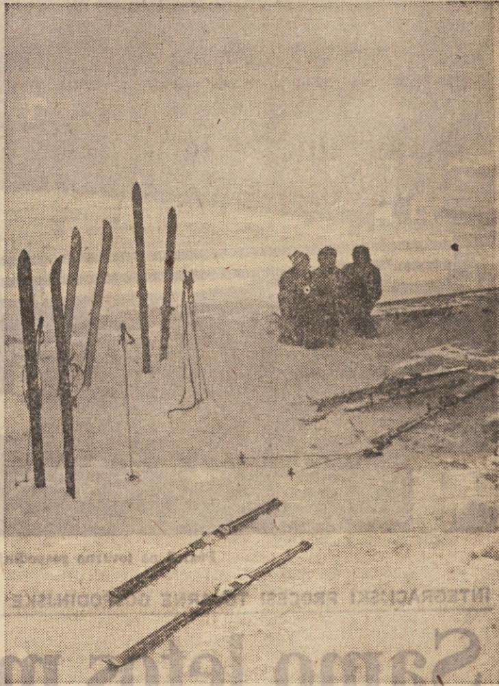
Kratek oddih, pa spet na dilce!

● športna društva so finančno še vedno vse premalo močna, da bi lahko vključevala več delovnih ljudi v svojih vrstah in s tem omogočila aktivno rekreativno športno dejavnost.