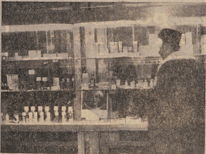
Vzorčne vitrine v prodajnem oddelku Kemofarmacije

In to je eden izmed glavnih adutov podjetja, ki ga v komercialnem pogledu tudi uspešno izkorišča.