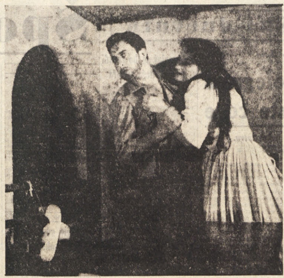
Prizor iz O'Neillove drame «Strast pod brestii, ki jo je SNG uprizorilo sinoči v Skednjo, nocoj pa jo bodo lahko gledali v dvorani na Opcinah.

na prejšnji ravni, je francoska vlada odredila njihovo blokado, kar pa je neprijetno vplivalo na vse zainteresirane kroge. Lastniki podjetij in trgovine so se tem ukrepom postavili po robu, ker jim onemogočajo normalni zaključek. Delavske organizacije pa so proti temu, da bi plače ostale na isti ravni. Glede tega so najbolj zgovorna mešana gibanja. Prav tako zgovoren je odgovor podelstva, kjer kmetje dajejo dočka svojem nezadovoljstvu v vrsti stavk in drugačnih protestnih manifestacij. In kljub vsem tem vladnim ukrepom je prišlo do povisjanja cen, predvsem prehranbenim izdelkom. To kažejo tudi podatki francoskega finančnega ministrstva, kjer vidimo, da so cene skočile kar pri 23 artiklih od skupnih 38, dočim je pri 11 artiklih prišlo do neznametnega padca cen. Kot posledica vsega tega so velika mešana gibanja, pri katerih sodelujejo vse tri najvažnejše sindikalne organizacije.