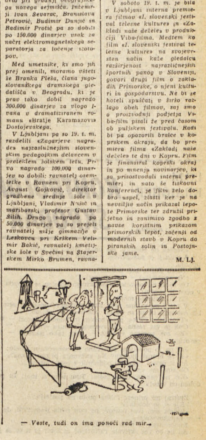
— Veste, tudi on ima poneči rad mir.

V soboto 19. t. m. je bila v Ljubljani interna premiera filma «Zakladi naše dežele» in slovenski ještvalni telesne kulture in «Zakladi naše dežele» v produkciji Viva-filma. Medtem ko film sl. slovenski festivali telesne kulture na svojevrstnem način kaže gledalca razširjenost najrazličnejših športnih panog v Sloveniji, govori drugi film o zakladih Primorske, o njeni kulturi in gospodstvu. Ne bi se hoteli zpuščati v široko razlago obeh filmov, saj smo o proizvodnji podjetja Viva-film pisali že pred časom ob puljskem festivalu. Radi bi pa opozorili bralce v koprskem okraju, da bo premiera filma «Zakladi naše dežele» te dni v Kopru. Film je finaniral koprski okraj in po nmenju novinarjev, ki so prisostvovali interni premieri, in nato se iskroni konferenci, je film zelo dobro uspel, zlasti ker je na neovstih način prikazal lepote Primorske ter zdrazil pritegnil in zanimivo zgodbo z našo uporabno prikazom primorskih lepot, začeni od modernih stavb v Kopru do pirsanskih solin in Postojnske jame.