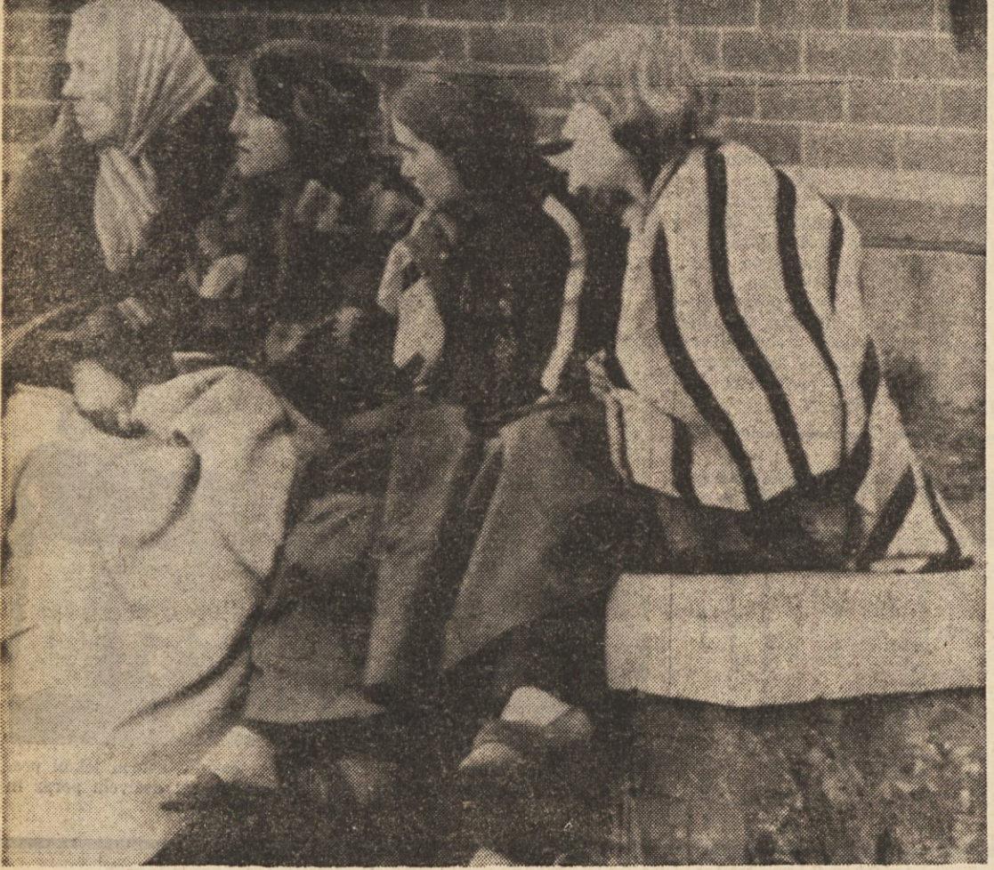
BARNSELY (Yorkshire - Anglija) — V premogovniku je prišlo kakih 400 m pod zemeljsko površino do eksplozije: pet rudarjev je umrlo. Vzrok nesreče še ni znan. Na sliki: žene ponesrečenec pred vzhodom v jašek.