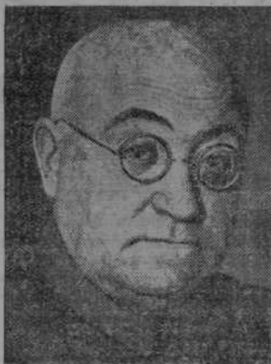
Rdeči branitelj Madrida general I. Miaja.

orožniki pridno na delu, da bi izsledili krivice, a vsa prizadevanja so bila doslej zaman, dasi je podpiralo pri zasledovanju komunističnih brezbožnežev oblast tudi še dobro prebivalstvo. V noči na 23. junij je bil izvršen dinamični napad na 10 m visoki in pol metra široki evharistični križ na Mengeškem hribu na Gorenjskem. Križ so postavili pred dvema letoma z velikim trudom ter veseljem. Ob petkih in nede-