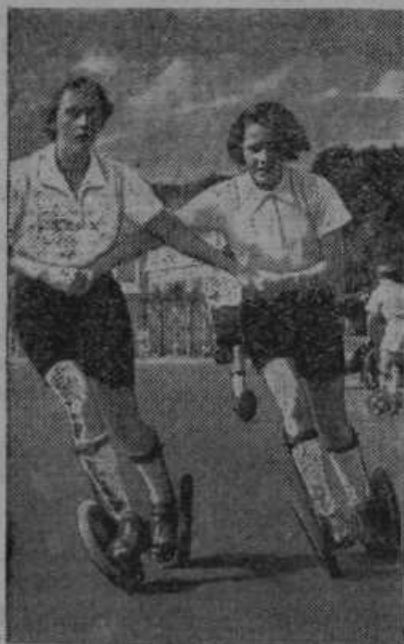
V Avstriji gojijo pridno novi sport s tako zvanimi poletnimi drsalkami na kolesih.

Napad z dinamično patrono na evharistični križ. Po Kranjskem so dobro organizirani in doslej še vedno prikriti brezbožniki na delu, ki podirajo, podžagavajo in z dinamitom razstreljujejo veličastne evharistične križe. Bogoskrunska kronika beleži napade na znamenja Križanega v Beli Krajini, na Notranjskem in Gorenjskem. Pred mesecem se je lotila satanska roka evharističnega križa v Kamniku in ga je razdejala. V vseh primerih so bili