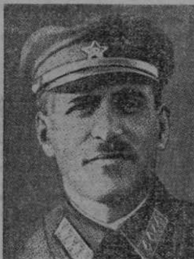
Sovjetski maršal Blücher, vrhovni poveljnik rdeče armade na Daljnem vzhodu.