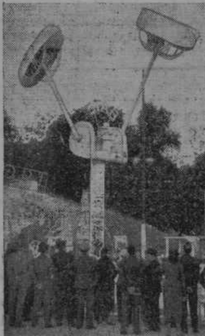
Na svetovni razstavi v Parizu se zabavajo obiskovalci s čisto novimi in svojevrstnimi gugalnicami.

ljah zvečer je bil razsvetljen z rdečimi žarčnicami, ki so mu dajale v temnih nočeh posebno veličasten kras. V omenjeni noči ob pol treh zjutraj so čuli ljudje v okolici Mengeškega hriba pok in so koj slutili, za kaj da gre. Šli so pogledat in so dognali, da je bil križ dober meter nad cementno podlago navrtan s svedrom kakih 25 cm globoko. V luknjo je bila položena dinamična patrona ter zažgana z vžigalno vrvico. Eksplozija je križ samo raztrgala v spodnjem delu, a je kljub temu ostal po koncu in je le posamezne lesene kose razgnalo po hribu. Naboj je bil preslab, da bi bil prevrnil znamenje. Pod križem so očividci izsledili dobro vidno stopinjo moškega nakovanega čevlja, ki je edina sled za storilcem.