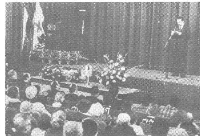
Z osrednje proslave ob 25-letnici krvodajalskih akcij v naši občini

Družbenopolitične organizacije in samoupravni organi v KS se morajo bolj vključevati v delo delegacij za SIS in DPS, ker je le tako mogoče zagotoviti, da se bodo v stališčih delegacij odražali interesi občanov in delovnih ljudi v KS Programi samoupravnih nosilcev, SIS in TOZD bi morali vsebovati ustrezne pobude in stališča delovnih ljudi in občanov iz KS, ne pa da že izdelani programi pridejo v krajevne skupnosti dejansko samo v potrditev.