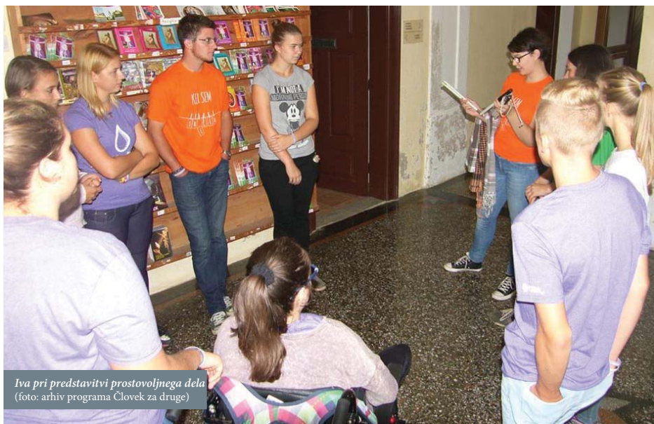
Iva pri predstavitvi prostovoljnega dela

deluje znotraj Društva katoliških pedagogov Slovenije , lahko prostovoljci izbirajo med različnimi področji dela: delo v vrtcu, učna pomoč, pomoč para- in tetraplegikom na domu, obiskovanje starejših, delo z begunci, druženje z otroki s posebnimi potrebami, pomoč na bazenu pri rehabilitaciji otrok, obiskovanje bolnikov in delo s slepimi osebami. Zaradi različne starosti, družbenega statusa in značilnosti uporabnikov na omenjenih področjih so izkušnje naših prostovoljcev res raznolike. Sama lahko (podobno kot mnogo prostovoljcev) potrdim, da je včasih dobro zamenjati področje prostovoljnega dela. Drugo področje predstavlja nov izziv, drugačen pristop k delu in tako širi naša obzorja. Izkušnja prostovoljnega dela nam omogoča, da se vedno znova učimo – ne le o delu samem, ampak tudi o sebi.