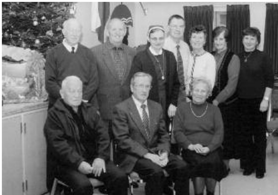
Odbor Vincencijeve konference ob jasliah pri Brezmadežni