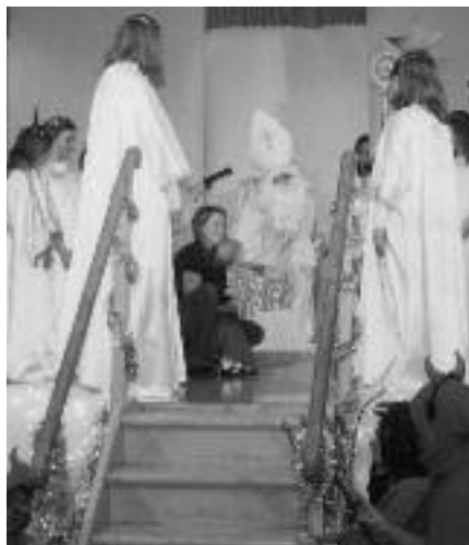
Sv. Miklavž s svojim spremstvom pri Brezmadežni

pastircem in k štalici, osvetljene od skrivnostne Luči. Tudi na sam božični dan smo imeli lep obisk, zlasti pri zadnji, angleški sv. maši.