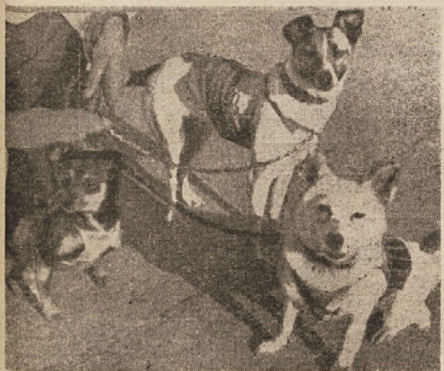
Sovjetski znanstveniki uporabljajo za poskusne polete v vsevirje psičke, kot nam jih kaže gornja slika.

obe psički vadili že nekaj mesecev tako, da sta se popolnoma privadili svoje vrstnemu bivališču za potovanje v vsevirje. Njuno biološko obnašanje med poletom ni bilo torej pod nikakim vplivom strahu ali drugih motenj. Kot so poročali sovjetski znanstveniki takoj po povratku posebne naprave, so in-