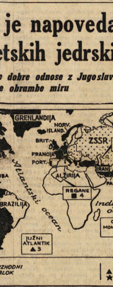
Tabela atomskih poizkusov do 6. aprila 1962