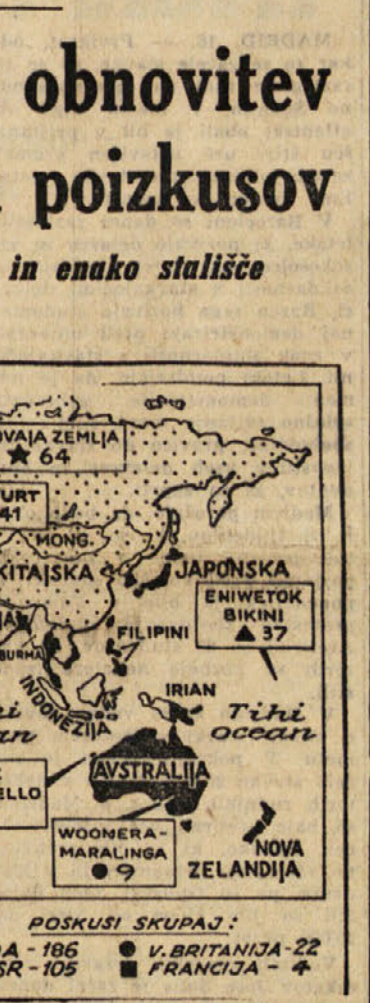
Tabela atomskih poizkusov do 6. aprila 1962