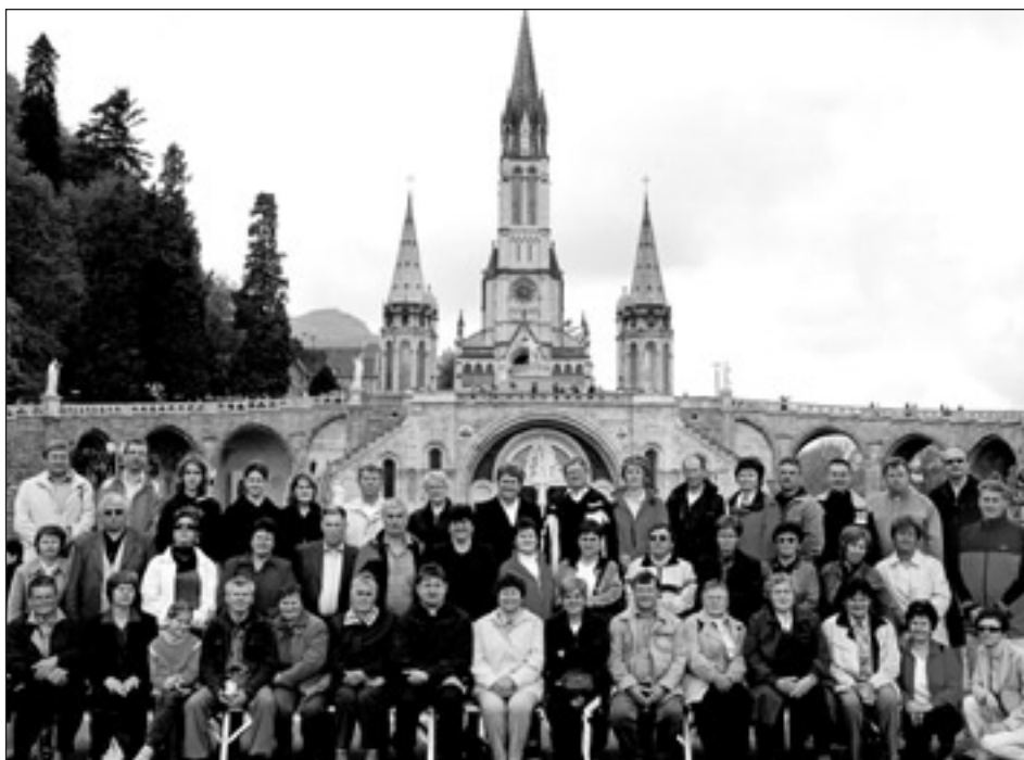
Združeni romarji pred lurškimi svetišči

Naslednji dan smo si po jutranji maši v kapeli sv. Gabriela ogledali Marijina svetišča, votlino prikazovanj in trg Esplanade, popoldne pa še v drugem delu mesta Bernardkino rojstno hišo, mlin Boly in nekdanjo mestno ječo »le cachot«.