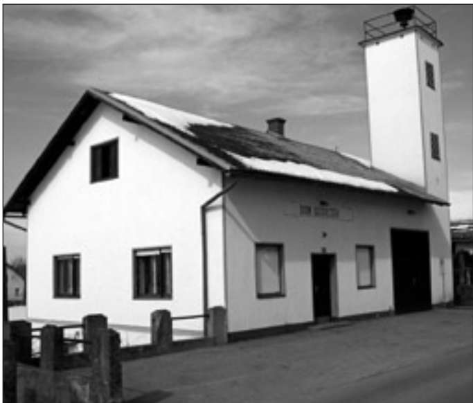
Stari gasilski (sokolski) dom so zgradili leta 1943, porušili pa 2004.

V paradi gasilcev, ki je bila ob slovesnem odprtju novega doma organizirana na nivoju gasilske zveze, je sodelovalo 172 uniformiranih gasilcev, med katerimi pa ni bilo markovskih, saj so le-ti morali biti pripravljene na pogostitev gostov. Zbralo se je tudi lepo število domačinov in gostov.