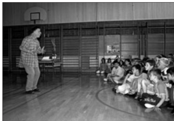
Pesnik in pisatelj Andrej Rozman Roza