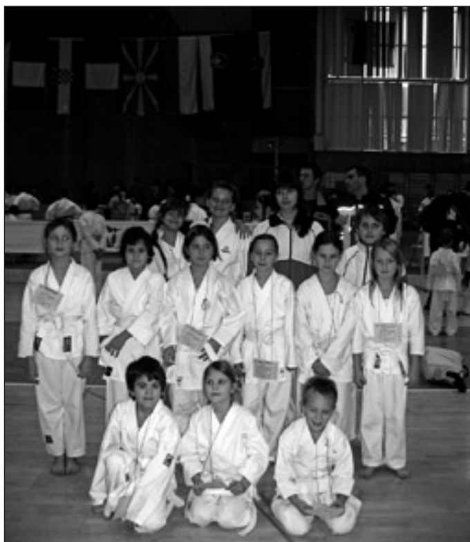
Trbovlje, december 2006: tekmovalci KK Markovci, skupaj s tekmovalci KK Ptuj

2. Kondicija: z rednim treningom je mogo-