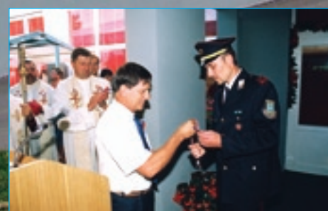
Novi gasilski dom v Markovcih