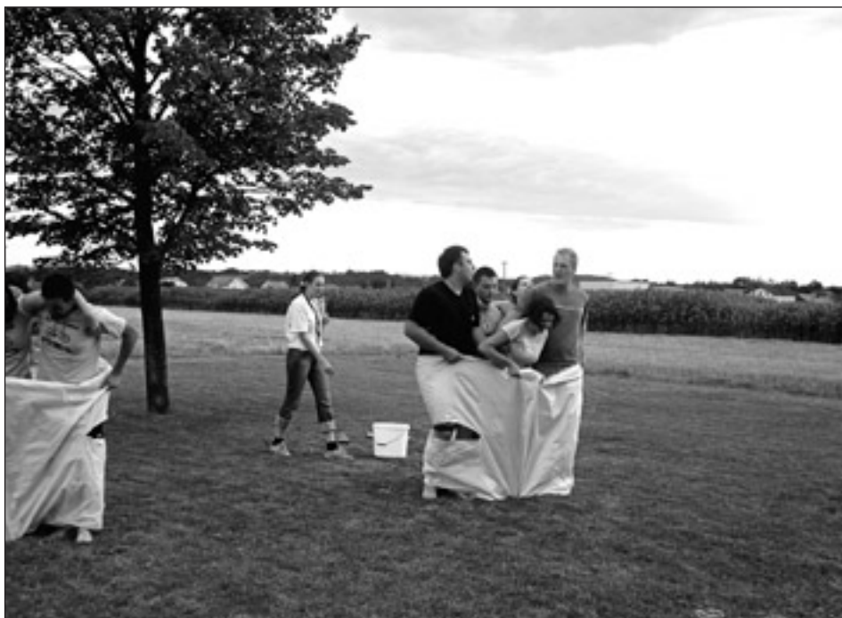
Tako so se v soboto, 30. junija, zabavali mladi naše občine.

Na koncu vseh petih iger smo ugotovili, da se je ponovila zgodba izpred dveh let,