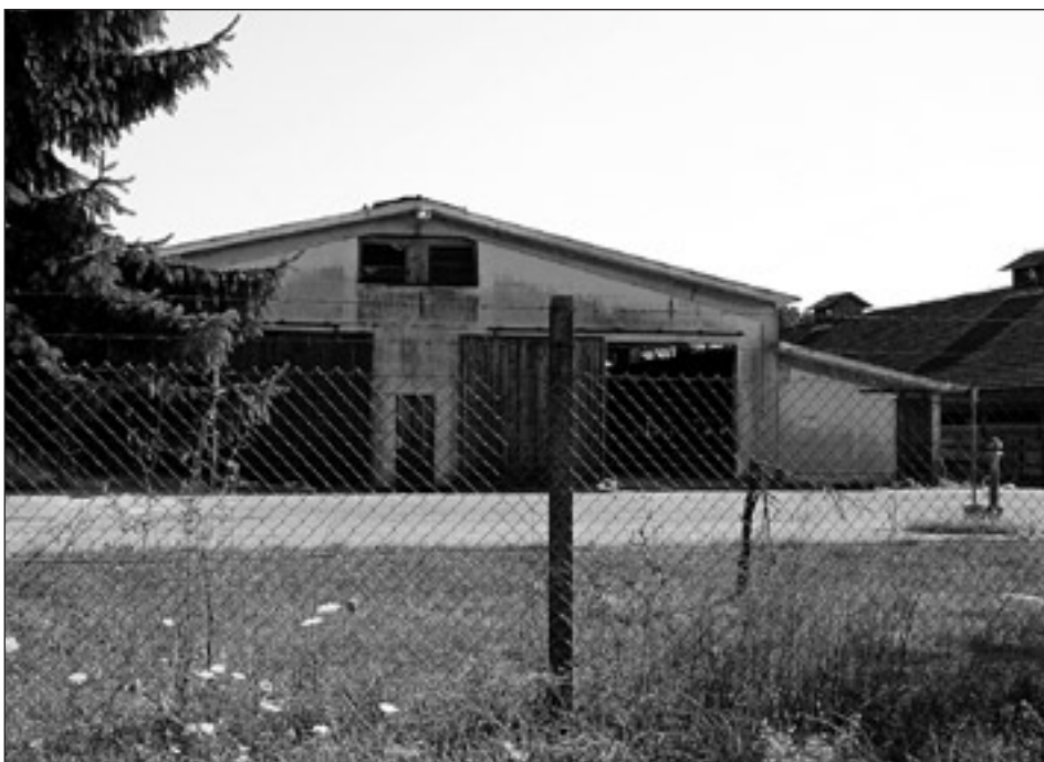
Problematika sobetinskih farm aktualna vseskozi.