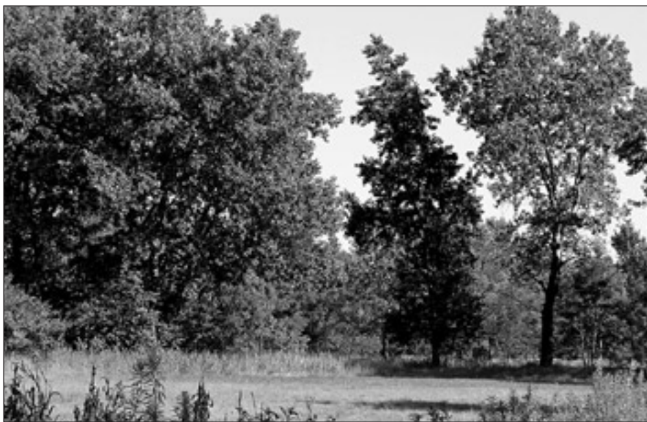
Pokrajina krajinskega parka Šturmovci naj bi bila primerna za prosto rejo škotskega goveda.

Krajinski park Šturmovci je s pristopom Slovenije v EU postal eden izmed mnogih parkov v Sloveniji, ki je še dodatno zaščiten leta 2004 z Naturo 2000. V področjih, ki so zaščiteni z Naturo 2000, vlada posebni režim gospodarjenja: s ciljem po ohranjanju avtohtonih in endemitskih (samo tu živčih) rastlinskih in živalskih vrst. V projektu TRUD (Trajnostno ravnanje in upravljanje s področjem ob Dravi), ki ga je financirala EU, smo želeli občine ob Dravi, ki smo se vključile v ta projekt z MRA, ohraniti to, kar je še ostalo od naravne dediščine ob Dravi oziroma v Šturmovcih.