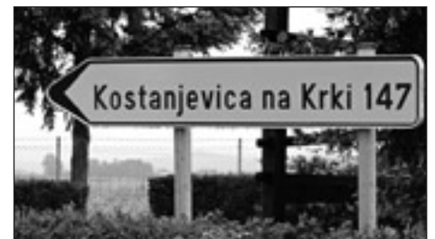
Nova smerna tabla v Markovcih, ki označuje pot proti prijateljski Kostanjevici.