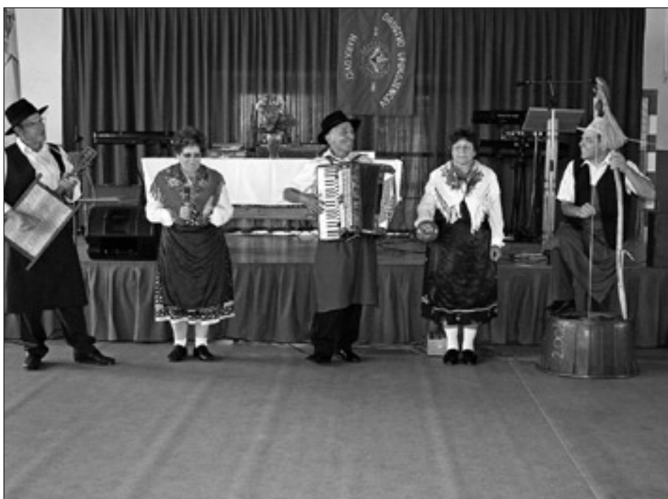
Hišni ansambel DU Markovci