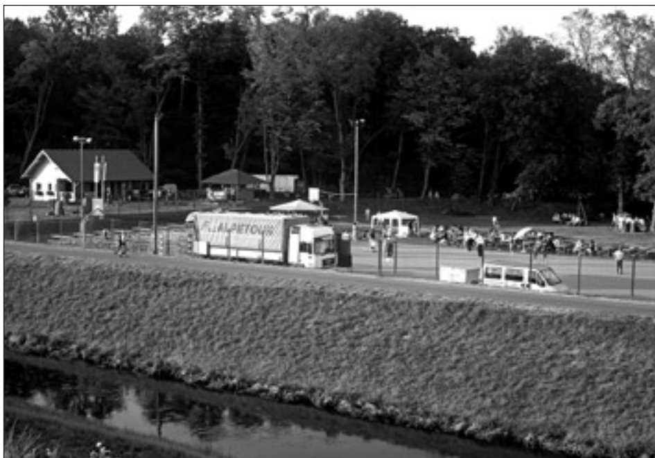
Na ptujski ranci se je gradnja rečnega pristanišča že pričela. V občini Markovci sta v okviru projekta Vitalizacija ptujskega jezera načrtovani dve vstopno-izstopni mesti v Zabovcih.