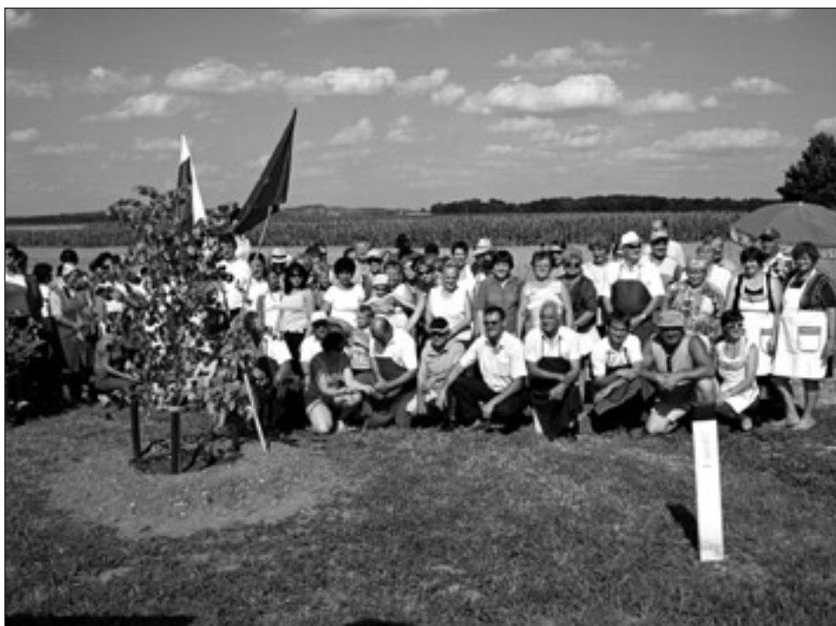
Skupinska fotografija Zabovčanov na dan državnosti ob vaški lipi