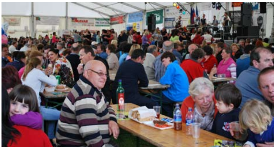
Obisk pod šotorom

Čestitke vodstvu in članom za zopet izredno izpeljano prvomajsko srečanje v Tuštanju.