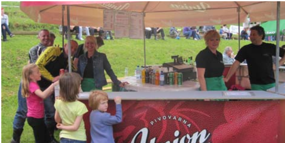
Poleg šotor so bili tudi »jurčki« zelo obiskani.