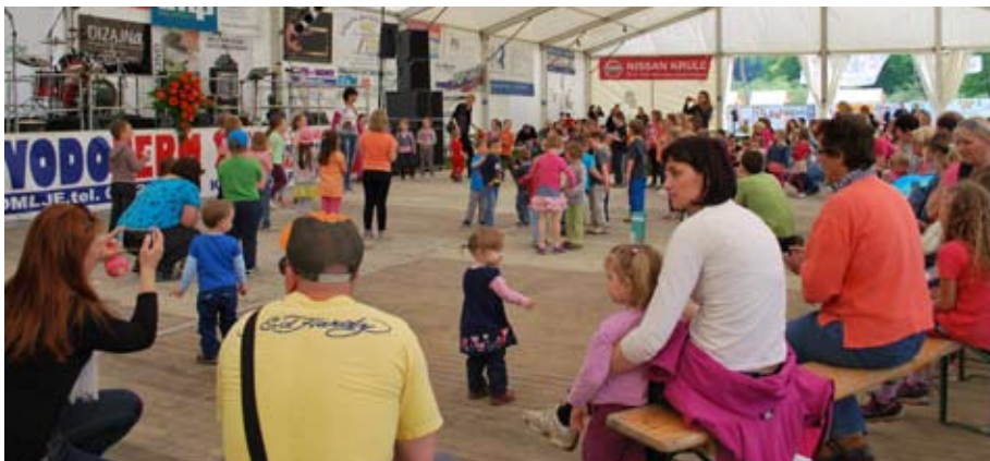
Živ - žav

v promet. Društvo se zaveda, da sta kvaliteta hrane in čistoča v kuhinji zelo pomembna dejavnika ponudbe. Družine z otroki so bile navdušene nad igrati. Na vhodu v prireditveni prostor so se predstavila moravska društva s slikovnim materialom za turistično ponudbo,