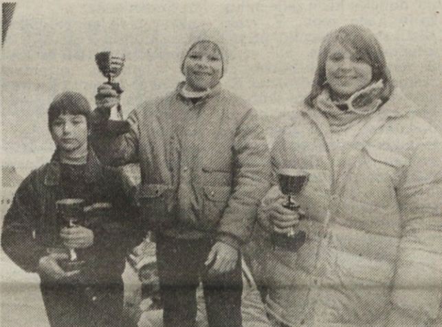
V družinskem veleslalomu so zmagale družine: Trobevše in Bradač iz Maloprodaje ter Valas iz DS SOZD Emona.