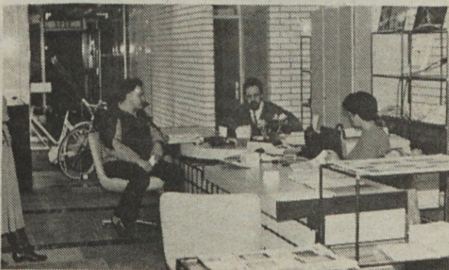
V novi prodajalni sektorja zastopstva tujih firm je dovolj prostora za razgovor in ogled prodajnih artiklov.