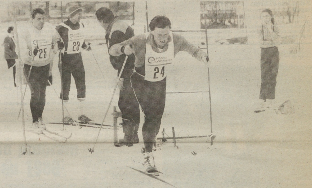
Z zimskih športnih iger Emone – 1 – 2 – 3 – start!