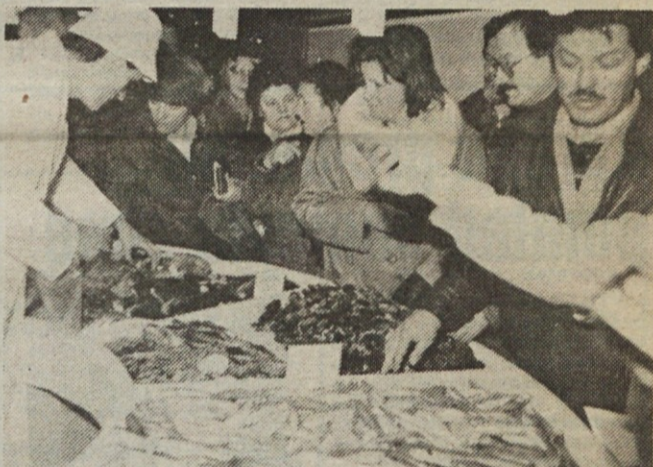
Prvi tržni dan v novi ribarnici Maximarketa – če je dobra ponudba, je tudi kupcev dovolj.