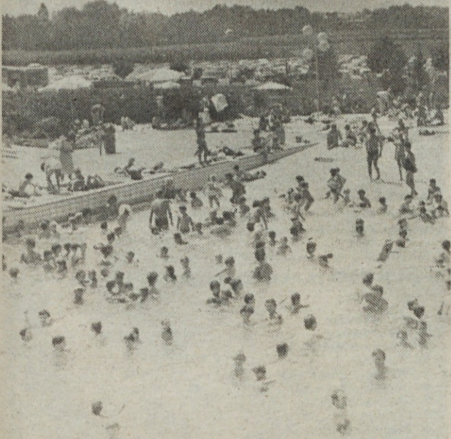
Kad je leti lepo u Ptujskim Toplicama ima više kupača nego vode