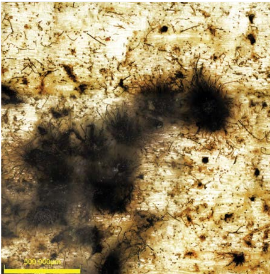
Slika 2: Rast plesni na površini lesa Figure 2: Growth of staining fungi on the surface of the wood