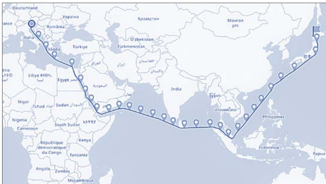
Slika 1: Pot ladijskega kontejnerja z lesom