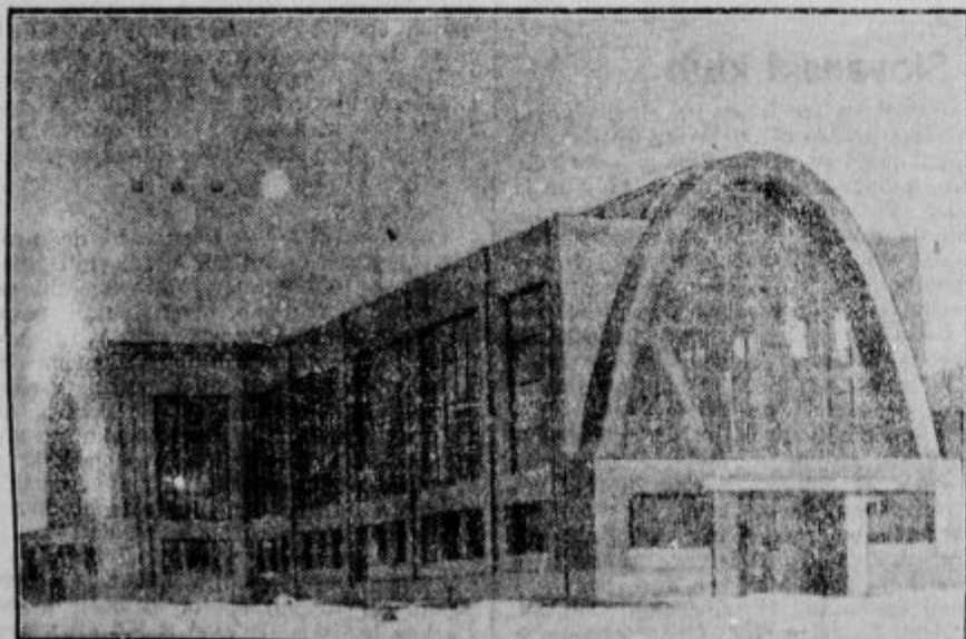
V Brnu bo od maja do septembra razstava sodobne češkoslovaške kulture. Za to so Čehi zgradili posebno stavbo, znamenito radi tega, ker je v notranjosti izredno sveta.

Angleška letalka Lady Heath, ki namerala iz Kaira poleteti preko Sredozemskega morja, se je obrnila na angleške oblasti, da bi ji preko morja oskrbele spremstvo. Angleške oblasti so to odbile, naker se je letalka brzojavno obrnila z enako prošnjo na Mussolinija, ki je letalki takoj dal na razpolago vodno letalo.