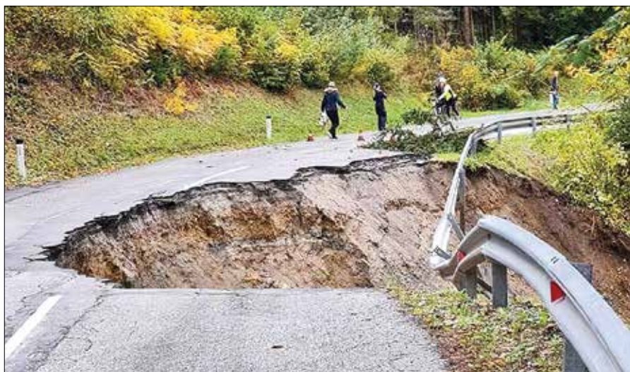
Zaradi plazu je cesta na Črnivec iz smeri Zadrecke doline zaprta za ves promet.

Po obilnem deževju v preteklem tednu se je na cesti med Novo Štifto in Črničcem v naselju Tirosek sprožil obsežen zemeljski plaz, ki je odnesel polovico cestišča, zato je cesta do nadaljnjega zaprta za ves promet. Sanacija bo glede na obsežnost plazu trajala dlje časa.