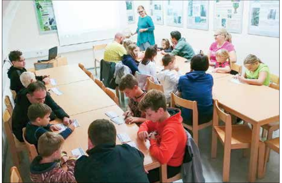
Tradicionalna otroška tombola v muzeju gozdarstva in lesarstva v gradu Vrbovec je bila dobro obiskana.