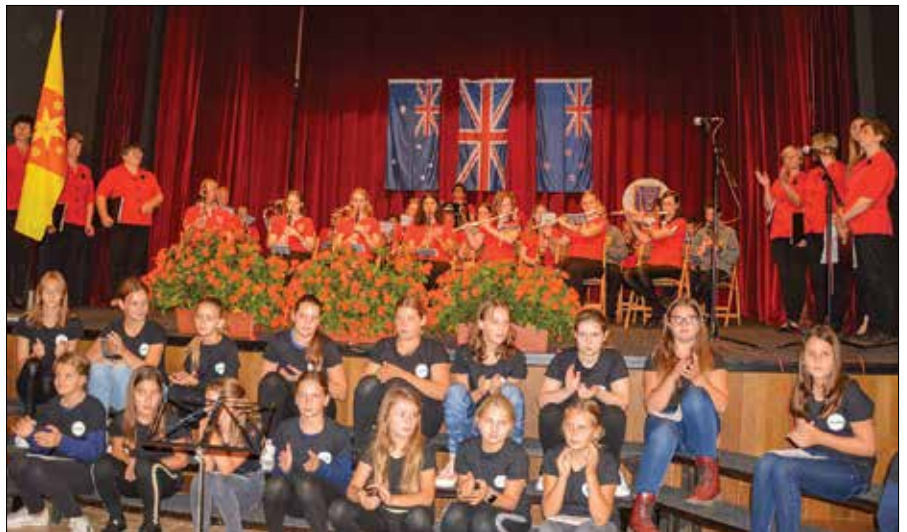
Kulturni program so oblikovali godbeniki, osnovnošolci in ženski pevski zbor iz Bočne.