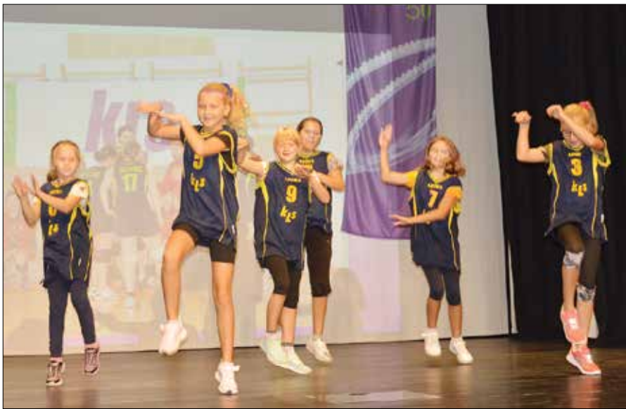
Najmlajše odbojkarice so s plesnimi točkami obogatile praznovanje.

ponovno zaživela odbojka. Za predsednika kluba so imenovali Sotoška. Prva leta so odbojkarice pridno trenirale, v svojem četrtem letu delovanja pa so začele nastopati v državnih ligaških tekmovanjih, tudi v pokalnem, z ekipami mladink, kadetinj in starejših deklic. Igralke so takrat prihajale na treninge iz celotne Zgornje Savinjske doli-