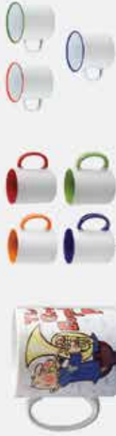
ŠALČKA, barvna + 1 €