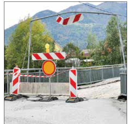
Most v Spodnji Rečici je zaprt, gradnja novega mostu se začne kmalu.

Začenja se rekonstrukcija dotrajane mostu čez Savinjo v Spodnji Rečici. Most je zaprt, z deli bodo pričeli predvidoma v prvi polovici oktobra. Večinski investitor bo občina, računajo pa na delno sofinanciranje Ministrstva za okolje in prostor iz sredstev za sanacijo posledic po naravnih nesrečah. Predvidena vrednost projekta je okrog 750 tisoč evrov, nov most naj bi bil končan junija prihodnje leto.