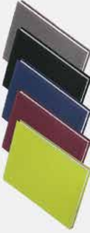
Rokovnik Clasic R0003 Viva R0002, Metalik R0001