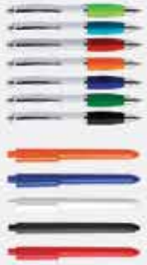
TERESA 153, BRISTOL 3018, C CARROFF 3011