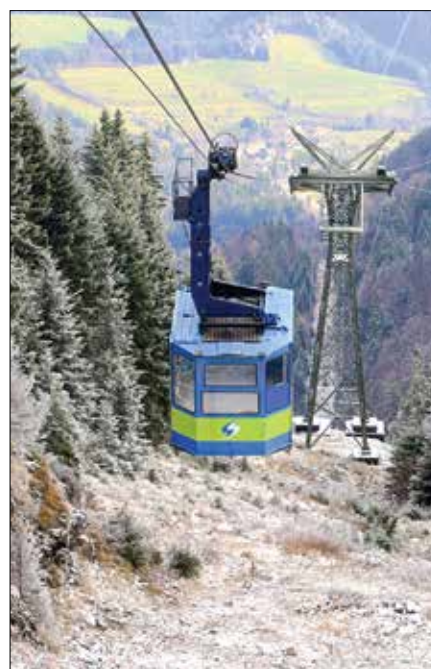
Zaradi tehničnih težav nihalka na Golte še vedno ne vozi.

Na Golteh poslovanje sproti prilagajajo trenutnim gospodarskim razmeram, zaradi ohranjanja stabilnosti poslovanja pa so sprejeli odločitev, da poletno sezono zaključijo s koncem avgusta in se v času do začetka zimske se-