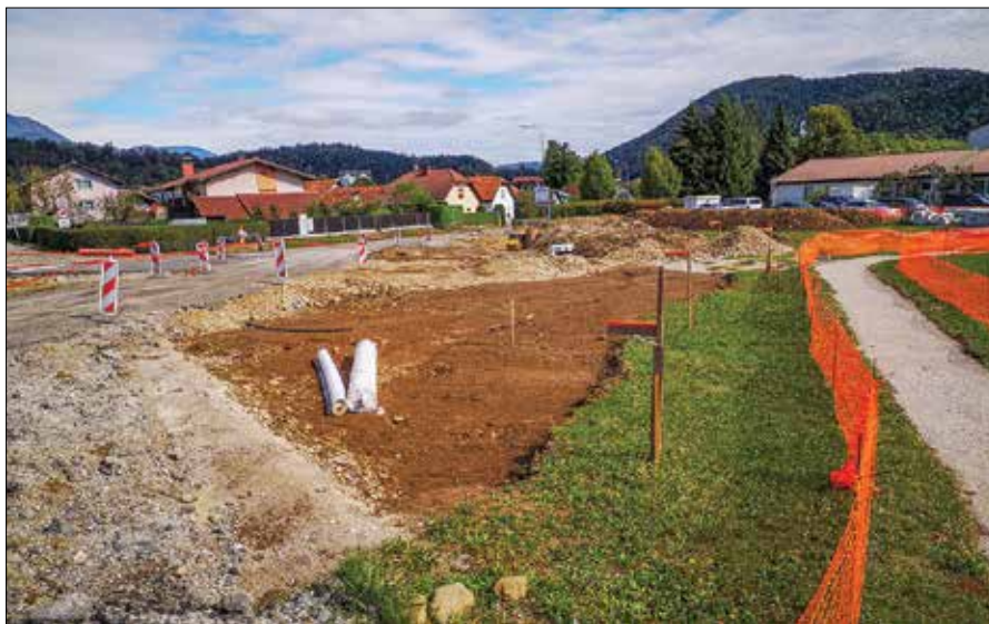
Novo krožišče bo umirilo promet, izboljšalo pretočnost in zagotovilo varnejše vključevanje na glavno cesto.

Površina, po kateri trenutno poteka promet, je asfaltirana, ostale površine so porezkane ali izkopane. Peš pot do osnovne šole so uredili razmeram primerno, steza je varna za uporabo in zaščiten z gradbiščno mrežo. Javno podjetje Komunala Mozirje je pred začetkom gradnje krožišča izpostavilo smiselnost obnove vodovodnega omrežja na območju gradbišča. Tako