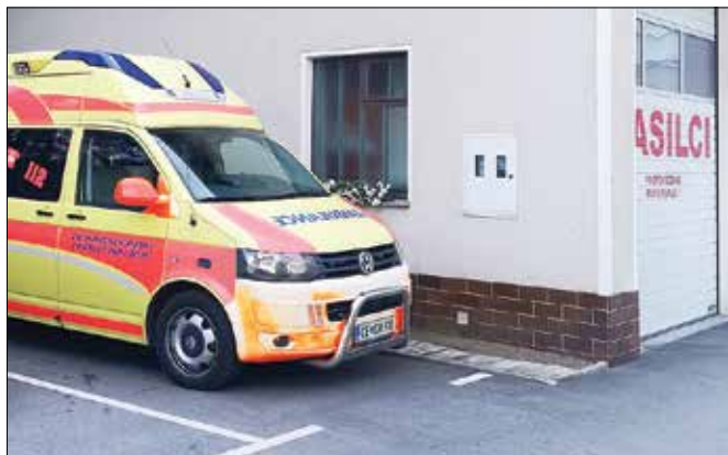
Vozilo nujne medicinske pomoči je na Ljubnem stacionirano od 6. do 18. ure.