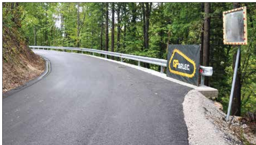
Podjetje Brlec je saniralo odsek ceste čez Lipo, ki je bil poškodovan zaradi plazu.