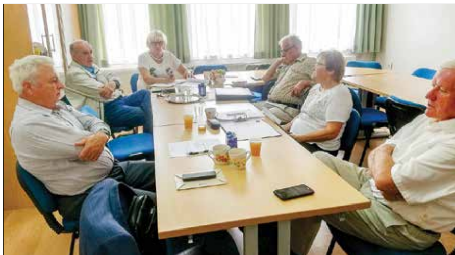
Seje nadzornega odbora DeSUS v Mozirju se je udeležil tudi predsednik stranke Ljubo Jasnič (drugi z leve).