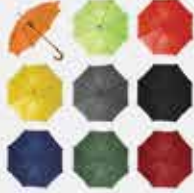
Dežnik LES AVTOMAT 4070

Velika izbira poslovnih daril v spletnem katalogu