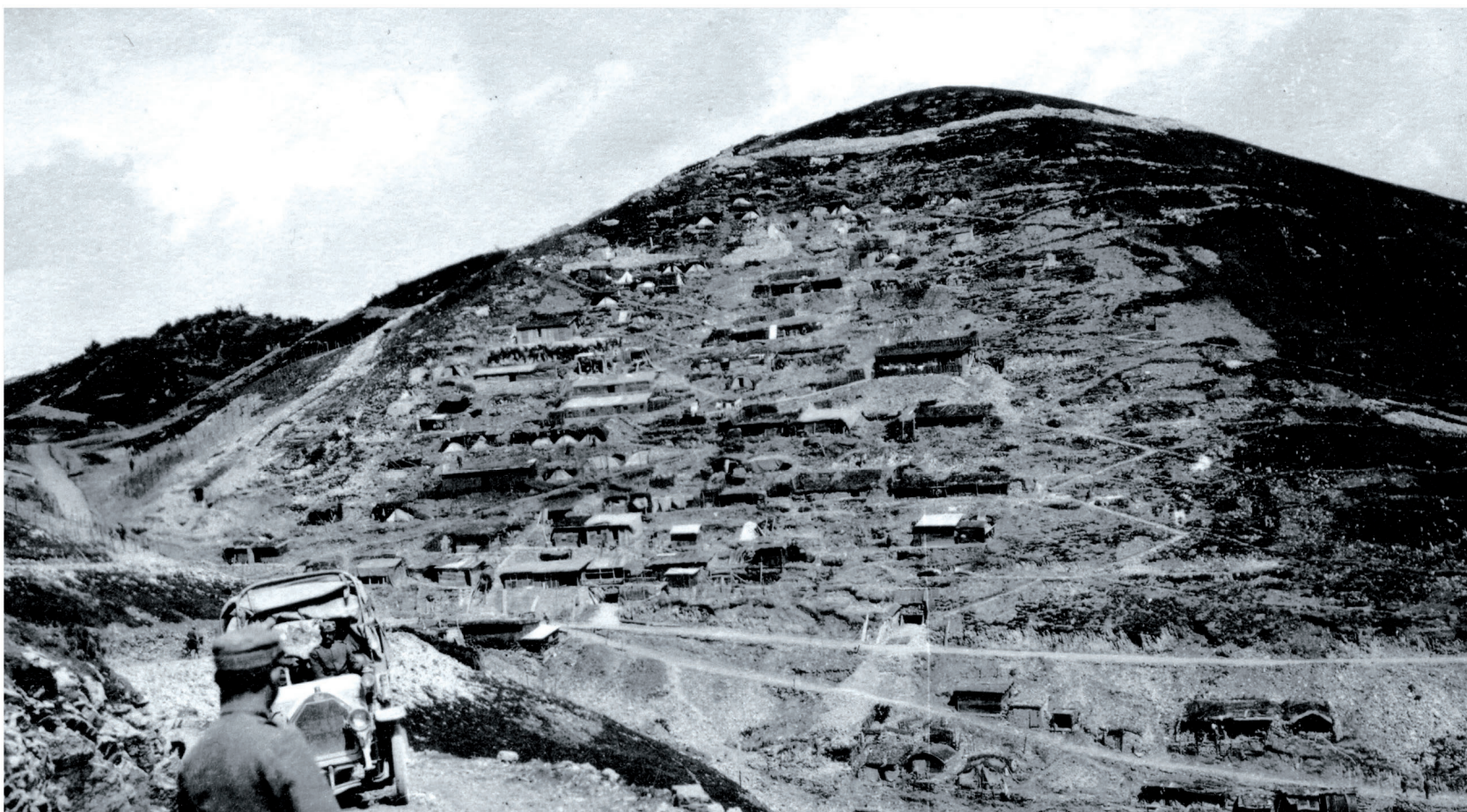
Klobuk med prvo svetovno vojno. Na fotografiji zgoraj, strelski jarek na Kolovratu.

2007-2013 cooperazione territoriale europea programma per la cooperazione transfrontaliera Italia-Slovenia evropsko teritorialno sodelovanje program čezmejnega sodelovanja Slovenija-Italija