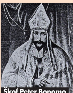
Skof Peter Bonomo

V slovenski zgodovini je škof Bonomo znan zlasti zato, ker je bil mecen in vsestranski podpornik Primoža Trubarja (1508-1586). Trubar je že v zgodnji mladosti prišel k njemu v Trst, bil tu uvrščen med cerkvene pevce in se pozneje nekaj časa šolal na Reki, nato se je pri Bonomu pripravljaj na duhovniški poklic. Bonomo ga je okrog leta 1530 posvetil v duhovnika in ga do svoje smrti vsestransko podpiral.